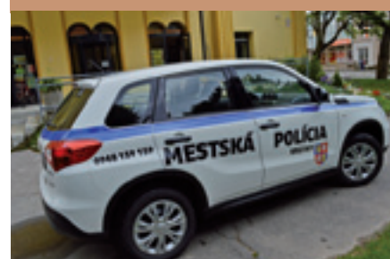
Kúpa nového vozidla pre MsP