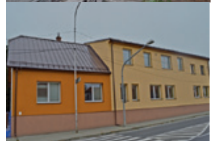
Rekonštrukcia MŠ Francúzskych partizánov