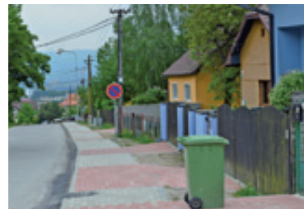
Rekonštrukcia chodníka Ul. Karvaša a Blahovca