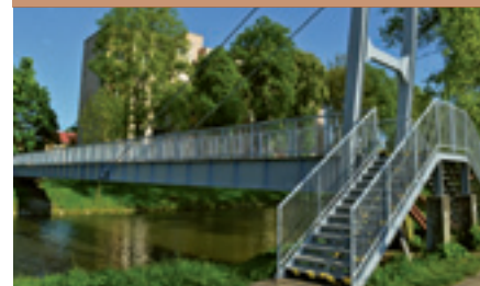
Nový náter lávky cez rieku Turiec