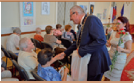
Stretnutia so seniormi

nehnutelností vydanéj Exekútorským úradom Mgr. Martinom Thomkom predmetom dražby určenej na 31.03.2017 s najnižším podaním vo výške 119.500,- €. Všeobecná cena draženej nehnuteľnosti bola znaleckým posudkom stanovená na celkovú sumu 239.000,- €. Výška kúpnej ceny odzrkadľovala výšku pohľadávok veriteľov Predávajúceho v celkovej sume 86.371,70 €, ktorú mesto na základe vzájomnej dohody s Predávajúcim uhradilo priamo na účty veriteľov resp. exekútorov, na základe čoho došlo k uvoľneniu tiarch k predmetným nehnuteľnostiam.