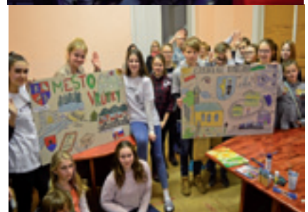
Spoločné stretnutia v rámci projektu Plnou parou vpred