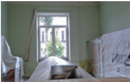
Výmena okien v budove MsÚ