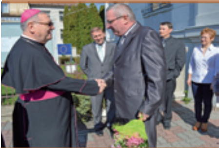
Návšteva biskupa Tomáša Galisa na úrade