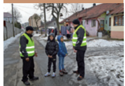
Miestna občianska poriadková služba