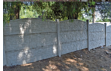
Plot na cintoríne pred a po rekonštrukcii