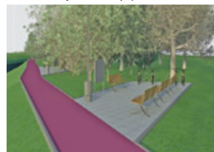
Časť budúcej cyklotrasy

a vrútocký úsek, čomu zodpovedajú samostatné projektové dokumentácie so samostatnými rozpočtami, samostatné územné aj stavebné povolenia a tiež dve samostatné žiadosti o NFP, ktoré na seba logicky nadväzujú a spolu tvoria kompaktný celok. Mesto Vrútky bolo úspešné pri čerpaní eurofondov. Momentálne sa začína realizovať projekt s rozpočtom za mesto Vrútky vo výške 66 245,-€, pri spoluúčasti 5%. Pozemok pod celou navrhovanou časťou cyklocestičky za mesto Vrútky je vo vlastníctve Slovenského vodohospodárskeho podniku, š. p., s ktorým mesto Vrútky uzatvorilo nájomnú zmluvu vo výške 1,-€/rok, preto iné pozemky pod plánovanú cyklotrasu mesto Vrútky nezačalo majetkovo vysporadúvať.