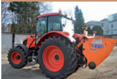
Kúpa nového traktora