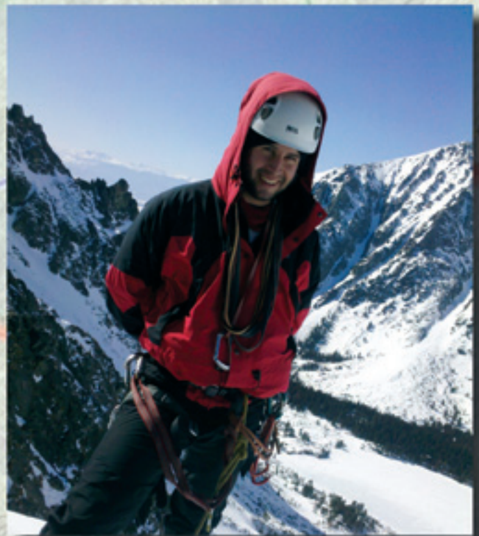
Zimný horolezecký výlet na Tupú