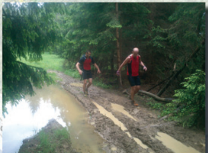
80km beh/ Chôdza /4500m prevýš./ . Šútovo-Zazriva-Terch.-M.Kriváň-Magura-Turč. Kľačany