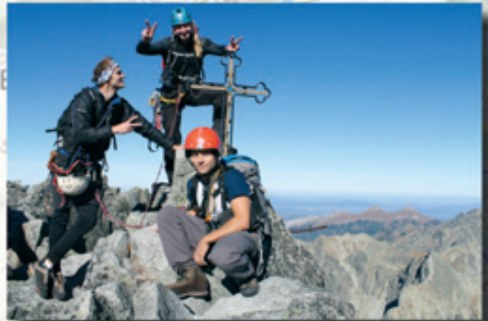
Spoznávačka na Gerlachu