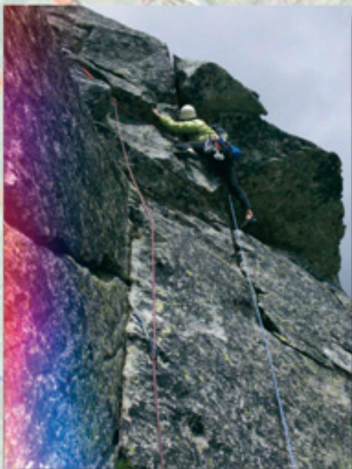
Cesta "Staré časy" na Ošarpanci. Vysoké Tatry.

Tyger ďakujeme za rozhovor a držíme ti palce.