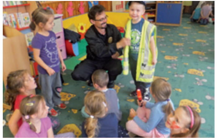
deti z MŠ na Ul. sv. Cyrila a Metoda