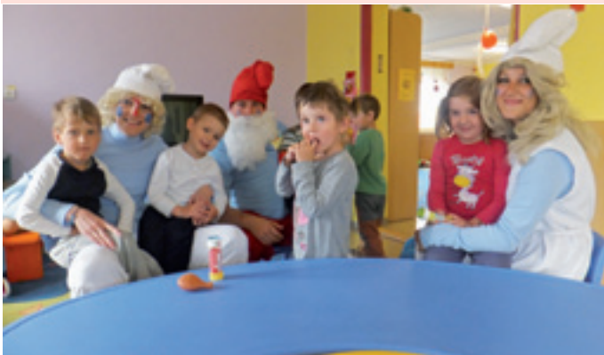
deti z MŠ na Ul. francúzskych partizánov