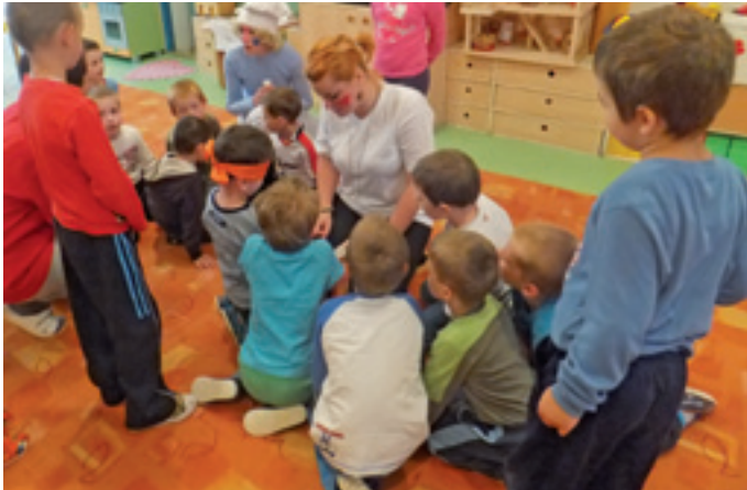
deti z MŠ na Nábřežnej ulici

Vrútockí škôlkari oslavovali tohtoročný sviatok MDD netradične. Odbor kultúry MsÚ Vrútky pripravil zaujímavý program, v rámci ktorého zavítali postupne do každej škôlky postavičky z rozprávky o Šmolkoch. Deti sa zabavili na hádankách, súťažiach, kreslení a mohli si aj zatancovať spolu so Šmoulinkou, Tatkom Šmolkom či Dudrošom. Páčilo sa im maľovanie na tvár, rozhovor s mestským policajtom a každé dieťa dostalo diplom a sladkú odmenu. Vo fotogalérii vidno malých škôlkarov, ako sa tešia spolu s organizátormi. -red-