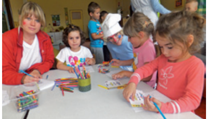
deti zo ZŠ s MŠ na Ul. M.R. Štefánika