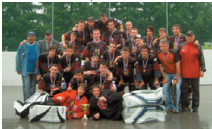
Hokejbalové družstvo U 18