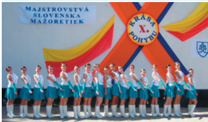
Turčianske mažoretky - juniorky pri nástupe

Krásne mladé dievčatá. V Turci sa o nich už čo-to vie. Súbor Turčianske mažoretky. Zúčastňujú sa na rôznych spoločenských, kultúrnych a športových akciách.