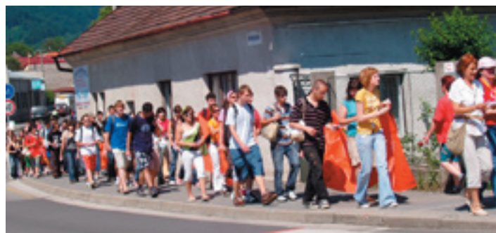
Vrútockí gymnazisti s poéziou putujú po uliciach Vrútok...