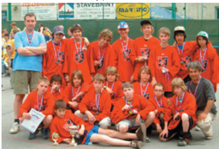
Hokejbalové družstvo U 14

V rokoch 2005 a 2006 družstvo starších žiakov vyhralo MAMUT CUP. Stali sa majstrami SR U 16. V roku 2006 v turnaji centier talentovanej mládeže kategórie U 16 MAMUT STREET LIGA sa starší žiaci KOMETY Vrútky stali víťazmi a získali Slovenský pohár.