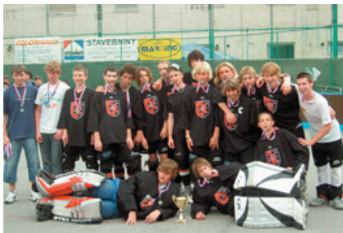
Hokejbalové družstvo U 16

V polovici mája sa konal 3. ročník turnaja O vrútocký putovný pohár v hokejbale mužov. Sedem mužstiev sa usilovalo získať ho: – v skupine A reprezentácia SR A, reprezentácia