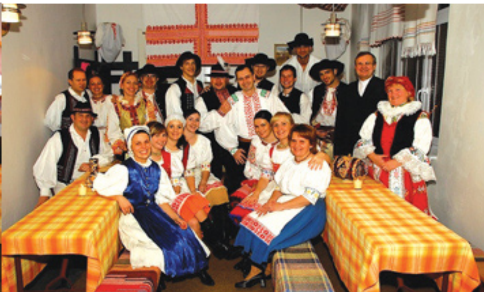
Organizátori VII. oravského plesu

V sobotu 20. novembra 2010 sa v Katolíckom kultúrnom dome uskutočnil VII. ročník krojovaného oravského plesu. Toto kultúrne podujatie si získalo svojich priaznivcov všetkých vekových kategórií, no zvlášť zaujímavým ho robí atmosféra, ktorá bola v duchu gazdovského dvora, tradičnej zabíjačky. V domácom tradičnom štýle sa po-