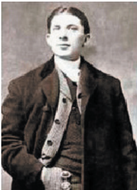
John Hertz ako dvadsaťročný (1899) s medailou z boxerského šampionátu v pravej ruke

Corporation. Korporácia bola napokon predaná firme General Motors a Hertz ju pomenoval GM.