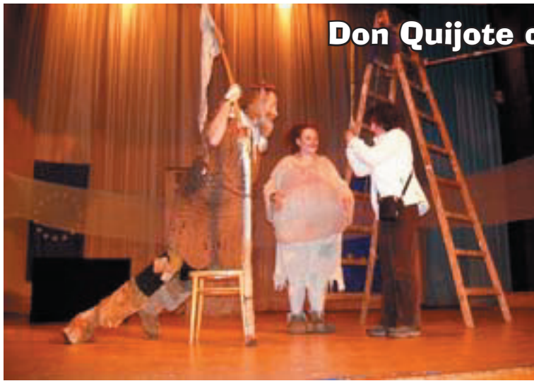
Don Quijote de la mAncha