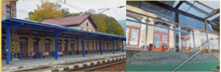
koniec októbra 2011 - nové 1. nástupište začína byť realitou