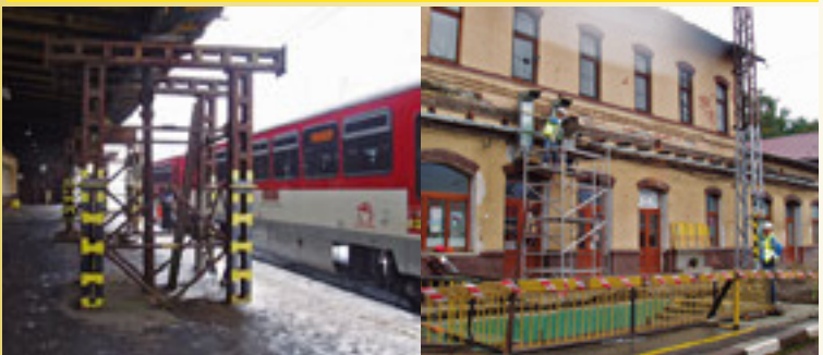
február roku 2011 havarijný stav 1. nástupíšť a