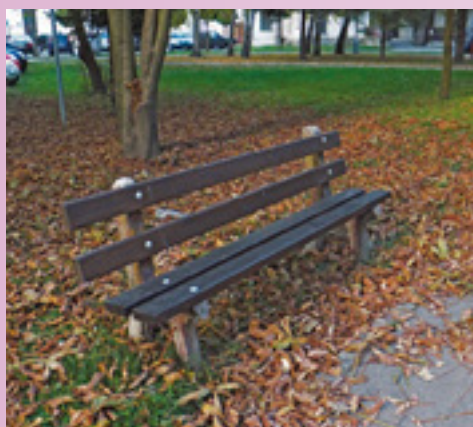
lavička pred panelákmi pri fontáne

Vzhľad mesta je veľmi dôležitý. Od funkčnosti a kvalitných služieb sa odvíja spokojnosť občanov. Prijemne strávené chvíle môžu prežívať obyvatelia Vrútok nielen doma vo svojich príbytkoch, ale k dispozícii majú aj oddychovú zónu vrútockej pešej zóny. Zrekonštruované námestie poskytuje hlavne deťom možnosť zábavy na drevených hračkách, ale aj dospelým posedenie pri dobrej káve či zmrzline. Na posedenie a oddych slúžia lavičky, sú rozmiestnené takmer po celom centre Vrútok. Na to, aby slúžili ešte dlho, je potrebná starostlivosť. Pracovníci odboru životného prostredia pravidelne dohliadajú na funkčnosť lavičiek, uskutočňujú výmenu poškodených dielov, montujú nové drevené časti, natierajú ich ochrannými nátermi. V meste nájdete staršie aj novšie typy lavičiek. Niektoré pamätajú roky - sú pôvodné s betónovým základom a iné sú nové a ľahko prenosné. V letných mesiacoch opravili 22 lavičiek. Zima pomaly klope na dvere, preto lavičky prezimujú v sklade. Na jar roku 2012 nám opäť budú slúžiť.