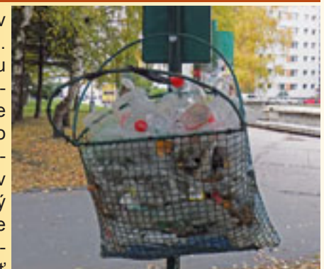
do psieho WC odpadky nepatria, ale patria do komunálneho odpadu.