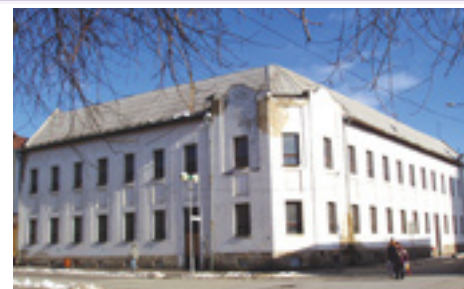
Bývalá „meštianka“ pred rekonštrukciou a po nej

Športové aktivity v meste sú realizované a účelovo podporované. V objekte ZŠ s MŠ na Ul. M. R. Štefánika a ZŠ Hany Zelinovej na Ul. Čachovský rad