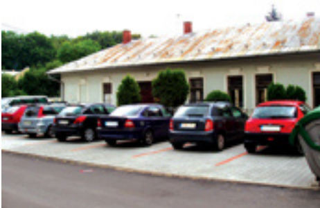
Parkovisko pred múzeom hotové

Tržnica v meste Vrútky je novopostavená od roku 2007.