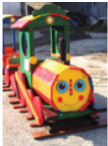
Drevený vláčik a nové osvetlenie