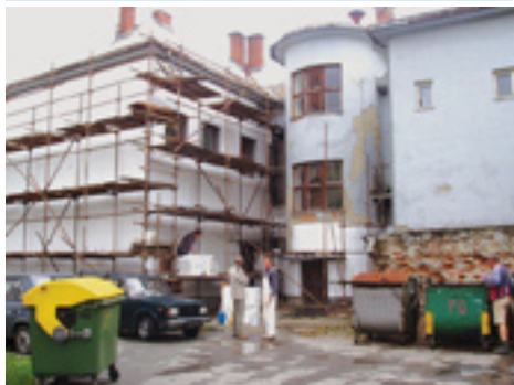
Budova mestskej knižnice pred rekonštrukciou a po nej