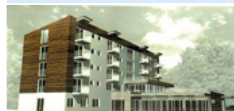
Navrhovaný dom pre seniorov