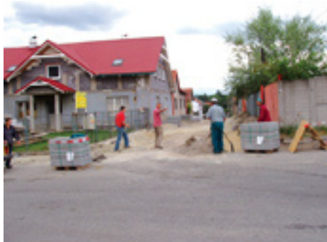
Rekonštrukcia Južnej ulice