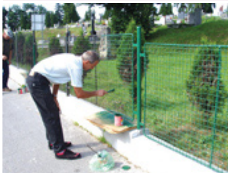
Maľovanie plota na mestskom cintoríne