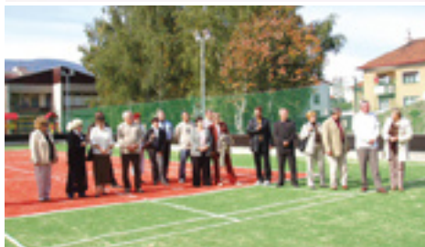
Otvorenie ihriska v ZŠ na Ul. M. R. Š.