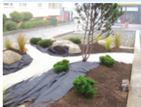
Budovanie mestských parkov