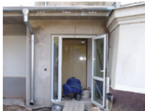
Práce na zriadení bezbariérového výtahu v budove MsÚ