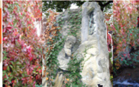
V novembri putujeme na cintoríny