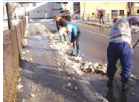
Zimná údržba ciest