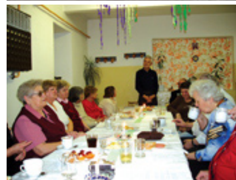
Seniorklub v DOS-ke