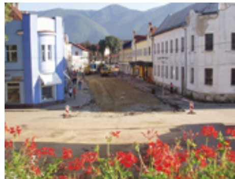
Vynovená pešia zóna