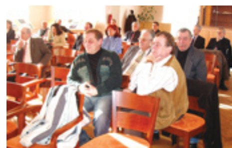
Stretnutie primátora s podnikateľmi