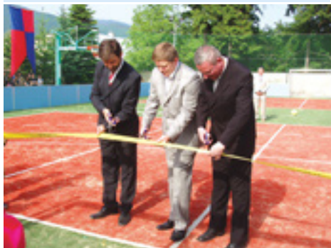
Otvorenie ihriska v ZŠ H. Zelinovej