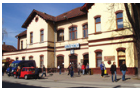
Železničná stanica pred rekonštrukciou a po nej