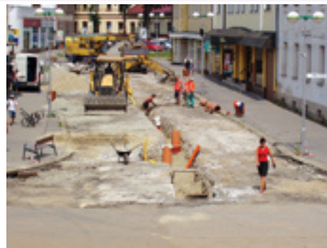
Rekonštrukcia pešej zóny

* V zmysle volebného programu bola zintenzívnená práca s miestnymi a regionálnymi spoločenskými, kultúrnymi a športovými inštitúciami, ako aj s jednotlivcami. Finančne boli podporované