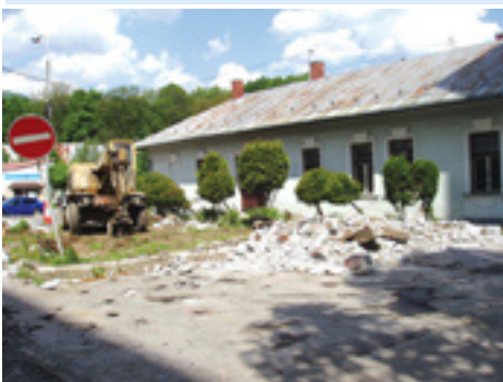
Rekonštrukcia parkoviska pred bývalým múzeom K. G.