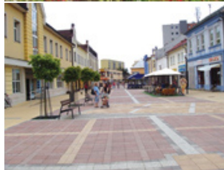
Vynovená pešia zóna