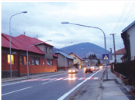
Osvetlenie na Ul. fr. partizánov