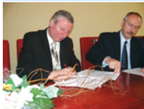
Podpis memoranda s Martinskou teplárenskou, a. s.