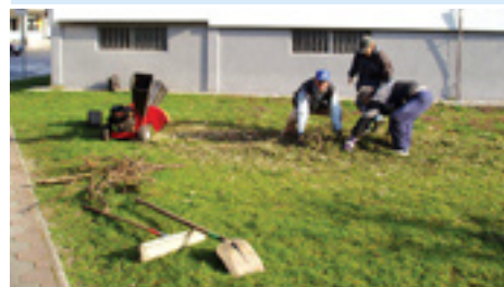
Udržiavanie mestskej zelene