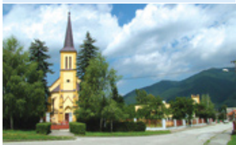
Evanjelický kostol Dr. Martina Luthera