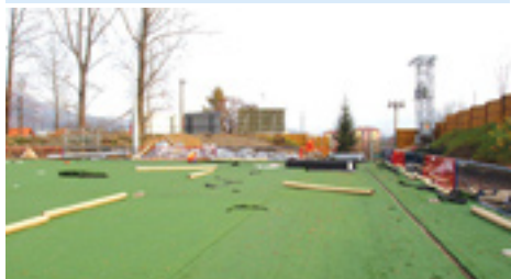
Rekonštrukcia futbalového ihriska