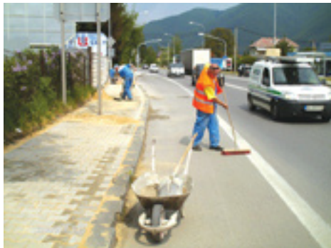
Budovanie chodníka na Ul. fr. partizánov