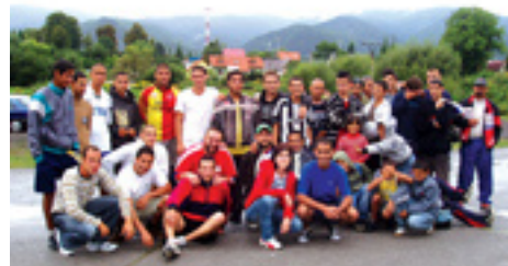
Rómsky futbalový turnaj