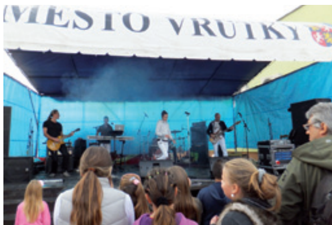
Vystúpenie popovej kapely PRETTY COOL