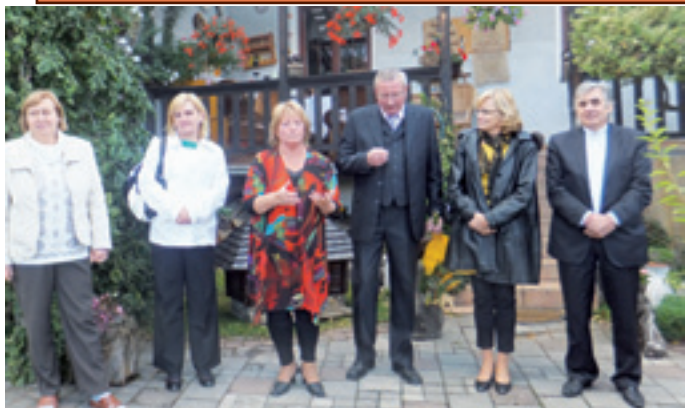
Záhradná slávnosť, na ktorej si návštevníci mohli pozrieť výstavu obrazov, drevorezieb, drevených domčekov a paličkovanej čipky .