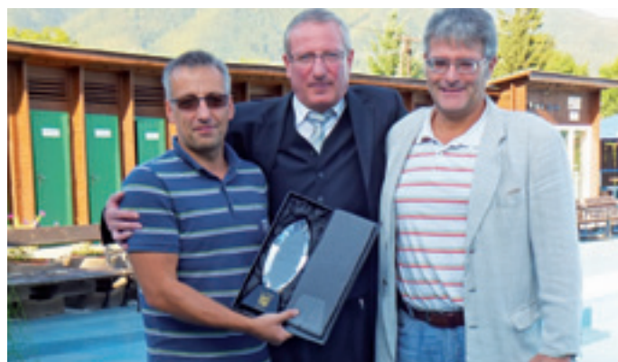
Vrútocký primátor odovzdal PVK Vrútky pamätnú plaketu pri príležitosti 80. výročia ich založenia

text na celej dvojstrane -red-, foto: RŽ, KL