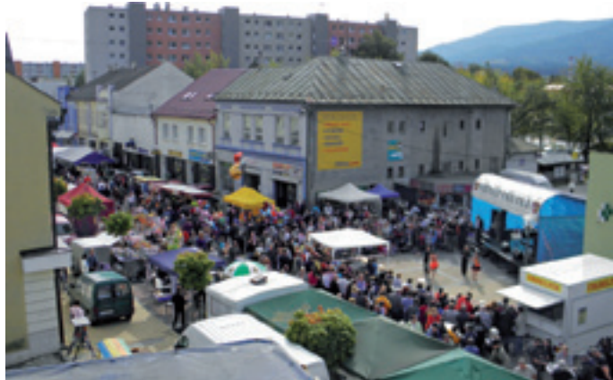
Jarmočná nálada v plnom prúde- takto to vyzeralo v piatok 21. septembra na námestí.