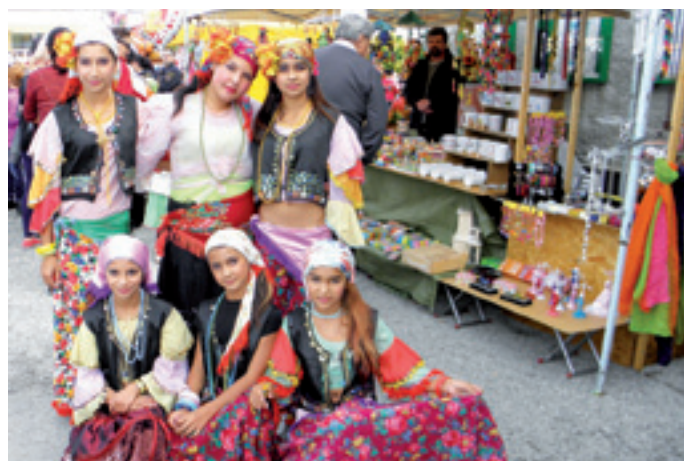
Dievčatá z CVČ DOMINO, ktoré zatancovali rómsky tanec