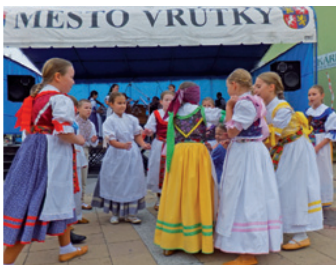
DSF Turiec, ktorý tento rok oslavuje 30. výročie založenia