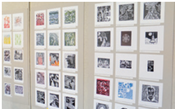
Malé grafické formy-Výstava prác ZUŠ Frica Kafendu