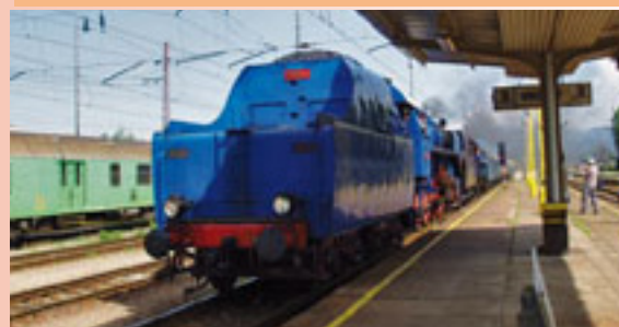
Vagón v júli 2008