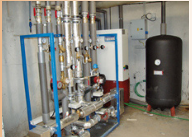
Výmenníková stanica je už napojená