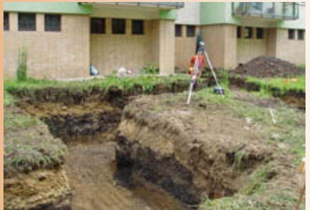
Realizačné práce sa v uliciach Vrútok začali