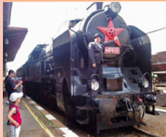
Vlak 464 v júli 2007