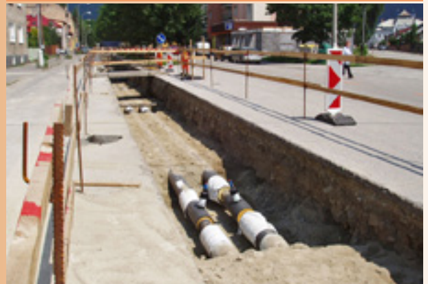
Uloženie potrubia do pieskového lôžka