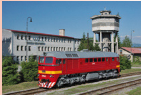
Nosná séria rušňov RP - 781 (ex. T 679.1) Sergej