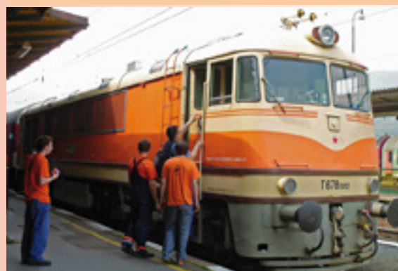
Vlak T 678 na MDD roku 2008