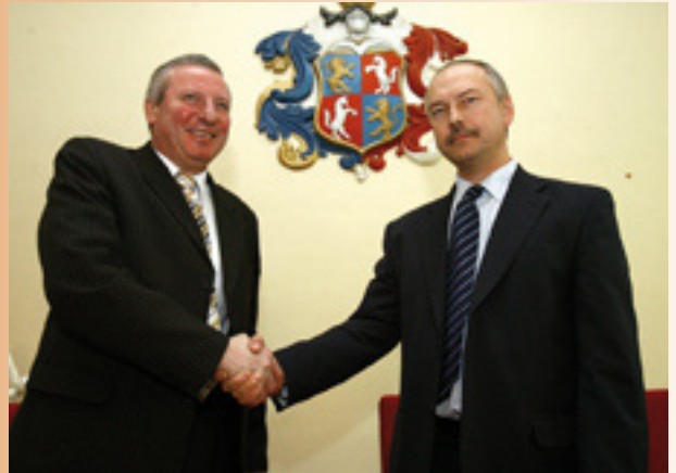
Podpísanie Memoranda s Martinskou teplárenskou, a. s.