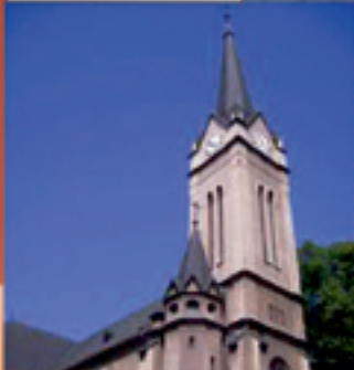
Slávnostná svätá omša