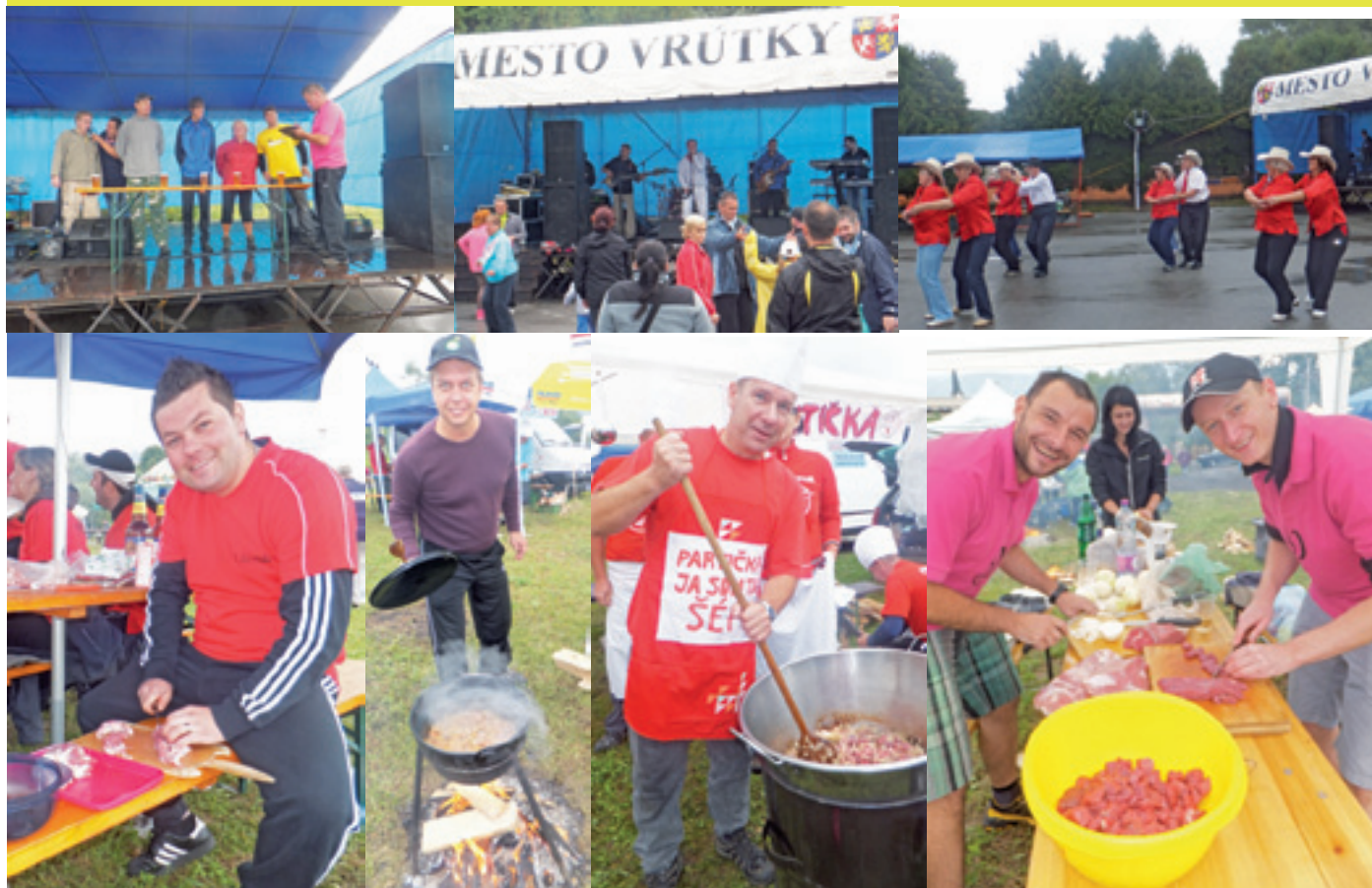
Na fotografii č.1 môžete vidieť súťaž v pití piva, č. 2 koncert kapely AYA, č. 3 vystúpenie Country skupiny Ruty-Šuty, č. 4 člen tímu Lienka, č.5 člen tímu Double rum, č. 6 člen tímu Partička, č. 7 tím Žalúdky