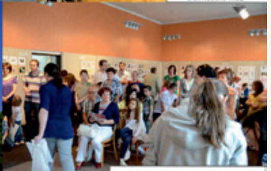
Základná škola Frisca Kafendu