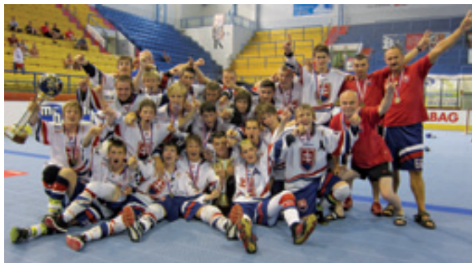
hráči z U16

nich skutočne maličkosti. To sa potvrdilo aj v nadstavbovej časti, keď sa všetky stretnutia okrem toho posledného skončili remízami a o finále ich pripravil až zápas, ktorý naši hráči sediaci na tribúne nemohli ovplyvniť. Potrebovali, aby USA nad domácimi zvíťazilo, naopak, domáci, ak chceli hrať vo finále, museli remizovať. Za stavu 3 : 4 pre USA prišlo minútu pred koncom k paradoxnej situácii, pri ktorej chceli obaja tréneri odvolať brankára. Keď sa už zdalo, že do finále postúpi slovenské družstvo, Američania v snahe zvýšiť skóre