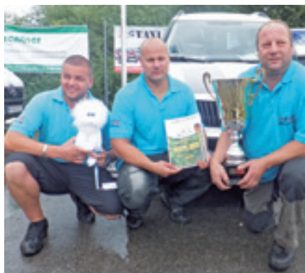
Družstvá: MS TEAM, BODAJBY