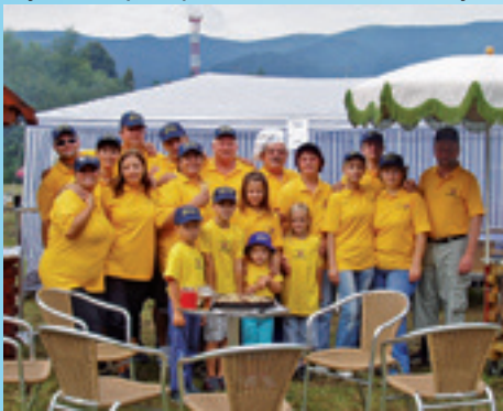
Uličníci z Bodenekovej