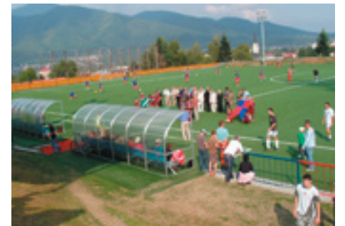
Otvorenie futbalového ihriska s umelým trávnikom

Vo Vrútkach pulzuje život. Spoločensko-politický, školský, kultúrny, podnikateľský a športový. Každá oblasť píše svoju novodobú históriu. Každú oblasť podrobne zaznamenáva časopis Vrútočan, ktorý je najpodrobnejšou vrútockou kronikou. Môžeme sa v ňom dočítať, ako píšeme novú históriu Vrútok. Z dvadsaťjeden ročníkov časopisu som čerpal informácie do tohto článku.