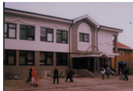
Nová vrútocká pošta