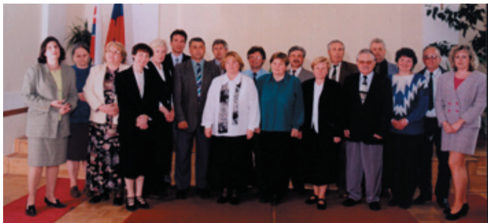
Vrútocký poslanecký zbor v rokoch 1999 - 2002

menili. Podnikatelia rekonštruovali svoje objekty, mesto robilo cesty, chodníky, verejné osvetlenie a v rámci možností opravovalo mestské budovy. Prebudovala sa celá cesta na Čachovskom rade, vrútocká pošta sa presťahovala