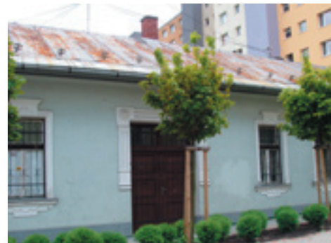
Budova bývalého múzea K. Gottwalda, v ktorej sídlil prvý vrútocký mestský úrad roku 1991