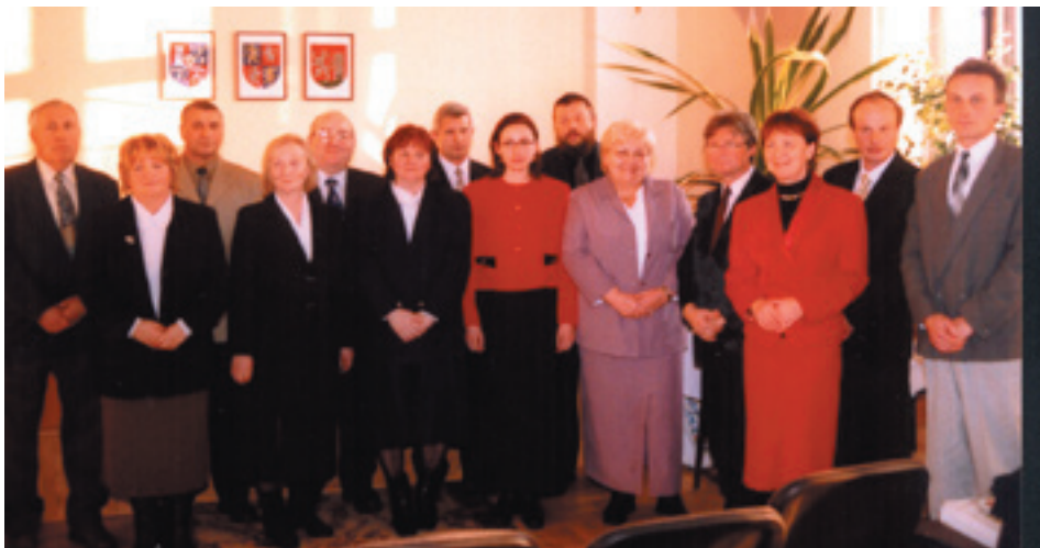
Vrútocký poslanecký zbor v rokoch 2002 – 2006