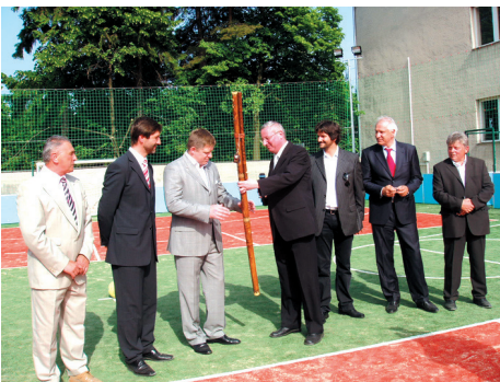
Otvorenie multifunkčného ihriska pri ZŠ Hany Zelinovej