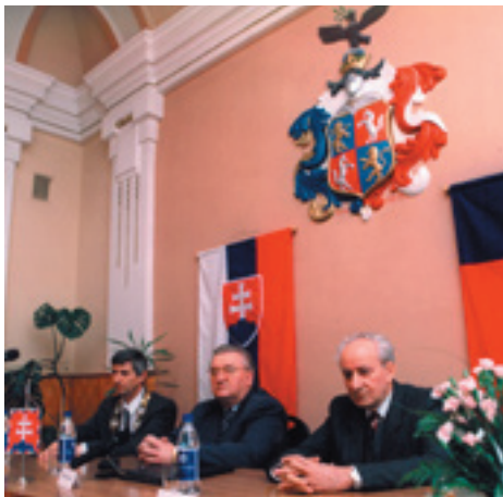
Návšteva prezidenta SR Michala Kováča