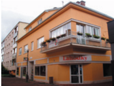
Zrekonštruovaná budova Mestskej knižnice H. Zelinovej