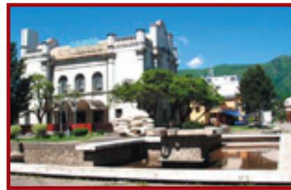
Bývalá židovská synagóga