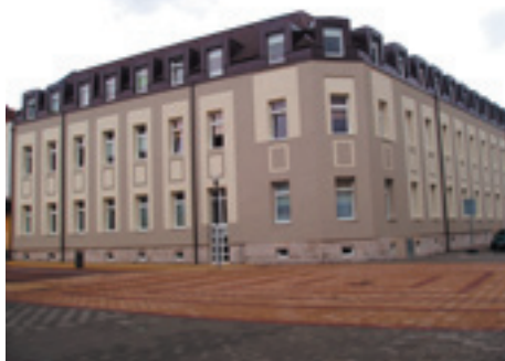
Nové mestské byty