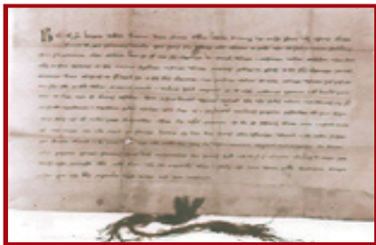
Prvá písomná zmienka o Vrútkach