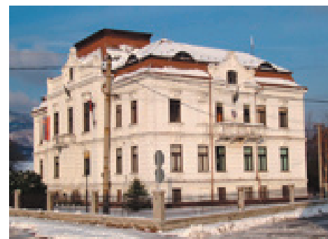
Obecný dom – tretí a terajší mestský úrad

Časopis Vrútočan začal vychádzať roku 1990. Prvé dve čísla vydala i zaplatila Demokratická strana. Začiatkom roka 1991 došlo k podpisu zmluvy, v ktorej sa DS vzdala vydavateľských práv v prospech mesta. V prvých rokoch vychádzal nepravidelne ako diskutér obyvateľov mesta Vrútok , od roku 1993 ako Vrútočan – regionálny mesačník Vrútok .