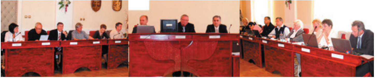
Rokovanie mestského zastupiteľstva – volebné obdobie 2007 až 2010