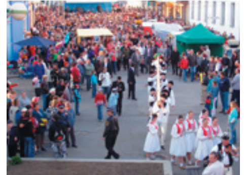
Stavanie mája za účasti predsedu vlády Roberta Fica

Milí spoluobčania, ako môžete konštatovať, úspešne sa nám podarilo zmeniť tvár mesta. Prebudovala sa železničná stanica, vybudovali sme pešiu zónu, schátralú budovu bývalej „meštianky“ sme prerobili na mestské byty. Na Ulici francúzskych partizánov sme vybudovali nové verejné osvetlenie. Mestská knižnica dostala nielen nový šat, ale prebudovali sa aj vnútorné priestory a detské oddelenie sa presťahovalo – k spokojnosti všetkých čitateľov. Pri obidvoch základných školách sú nové multifunkčné ihriská, vybudovali sme detské mobiliáry, vrútockí futbalisti sa môžu pýšiť krásnym futbalovým ihriskom s umelým trávnikom.