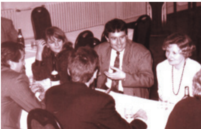
Z rokovania druhého vrútockého mestského zastupiteľstva