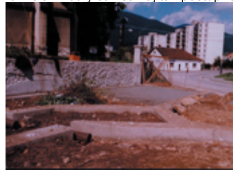
Prestavba cesty na Čachovskom rade