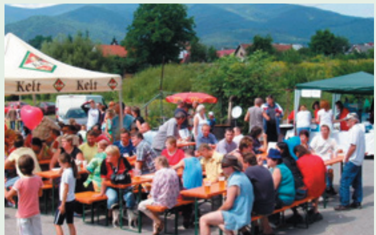
Veselo bolo na Country kotlíku 15. 8. 2009