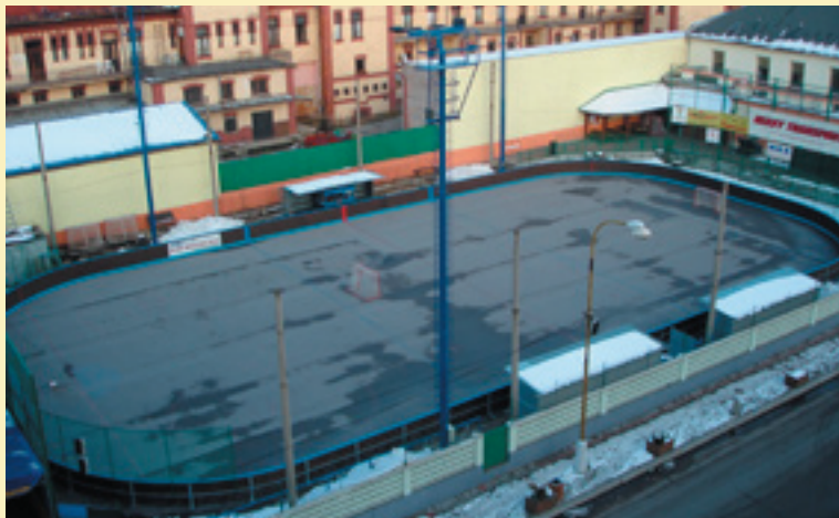
Hokejbalový areál vo Vrútkach za sokolovňou