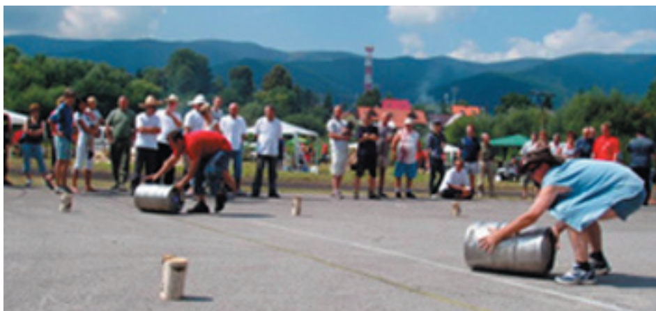
Súťaž vo váľaní sudov piva