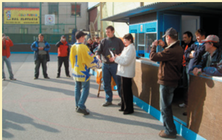
Odvzdávanie cien na DOMINO CUP 2008 – U-16