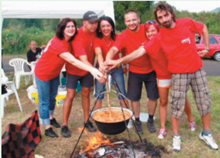
Hotový guláš družstva Sebranka