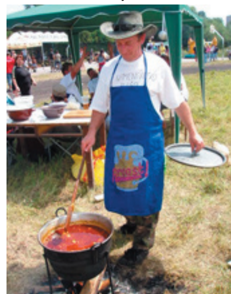
Hotový víťazný guláš