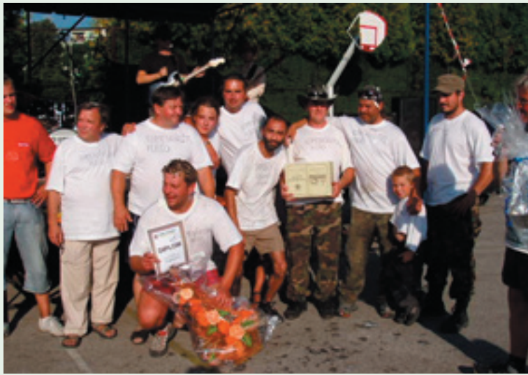
Tím Kamenárstva Plešo uvaril najlepši guláš