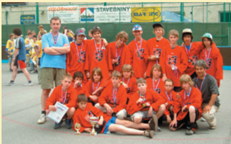
Majstrovstvá Slovenska 2007 vo Vrútkach – 2. miesto U-14