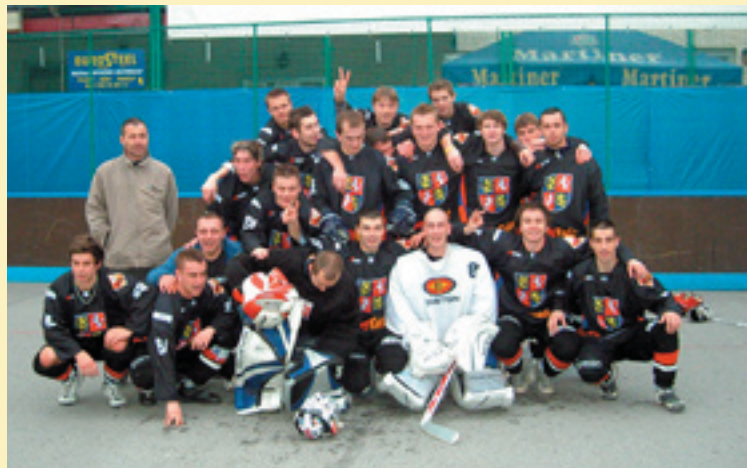
Extraliga 2008/2009. Muži po výhre nad Martinom