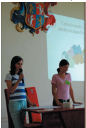
Rokovanie viedli dve kráľovné – vrútocká a martinská