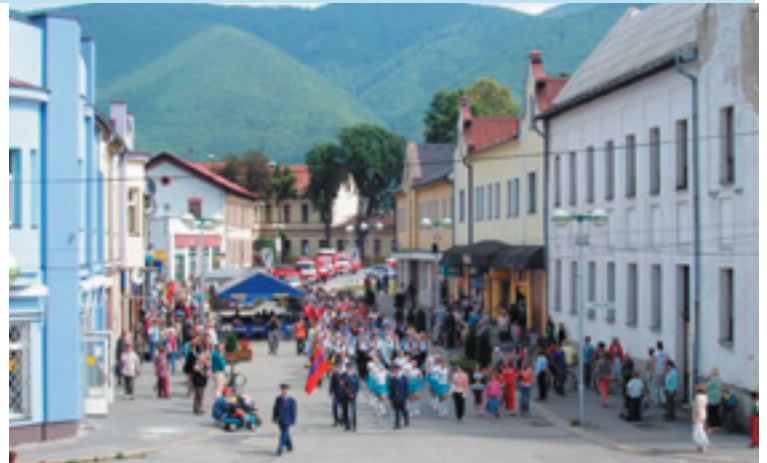
125. výročie hasičského zboru vo Vrútkach