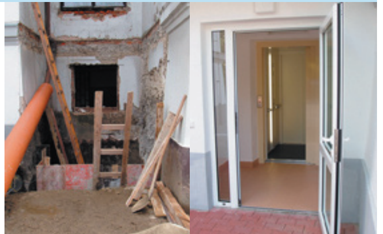
Vybudovanie bezbariérového vstupu do budovy mestského úradu