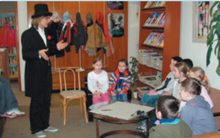
Andersenova noc v mestskej knižnici