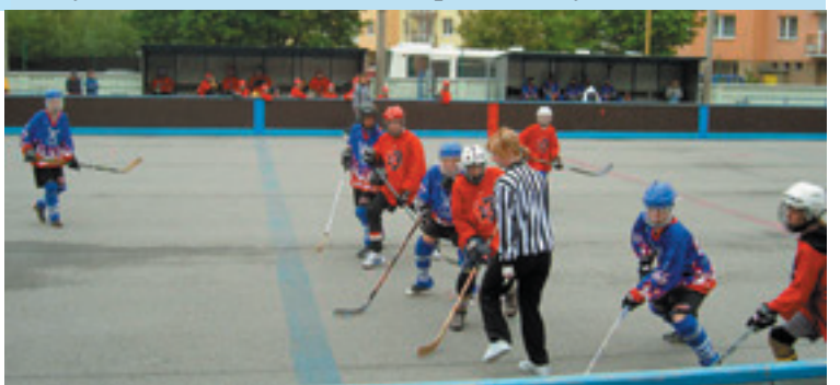
Hokejbalový turnaj DOMINO CUP na ihrisku KOMETA Vrútky

VRÚTOČAN * Adresa redakcie: 1. čs. brigády 14, 038 61 Vrútky * e-mail: kulturcentrum@stonline.sk * Tel.: 043/428 12 03, 428 12 19 * Nevyžiadané rukopisy a fotografie redakcia nevracia * Stanoviská v jednotlivých článkoch môžu a nemusia odrážať stanovisko redakcie * Vydáva: Mesto Vrútky - Redakcia Vrútočana * Zodpovedná redaktorka: Ing. Helena Pullmannová, redaktorka Renáta Žiaková * Jazyková redaktorka: Elena Režná * Redakčná rada: Ing. Jozef Stahl, Ing. Dušan Ertl, Božena Blahušiaková * Grafická úprava: Redakcia * Uzávierka dopisovateľských materiálov do 17. dňa v mesiaci * Objednávky na predplatné prijíma redakcia * Tlač: Neoprint Plus, Zamostom, Vrútky * Číslo reg.: 260/1991