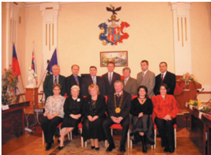
Nové vedenie mesta Vrútky po komunálnych voľbách v roku 2006