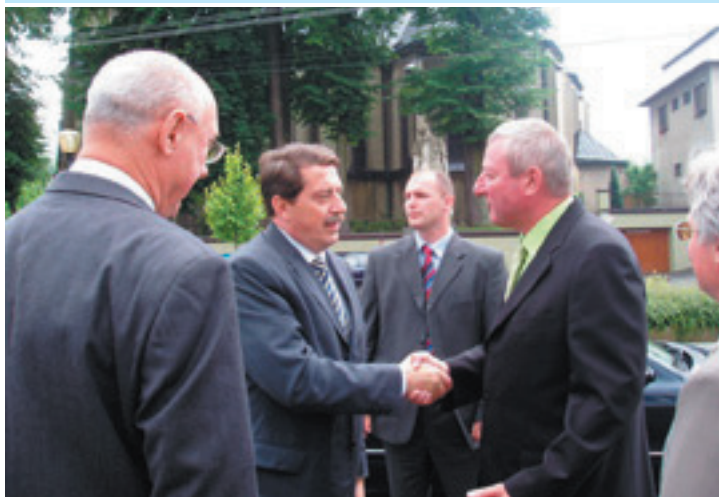
Pracovná návšteva predsedu NR SR Pavla Pašku (druhý zľava) vo Vrútkach v júli 2007