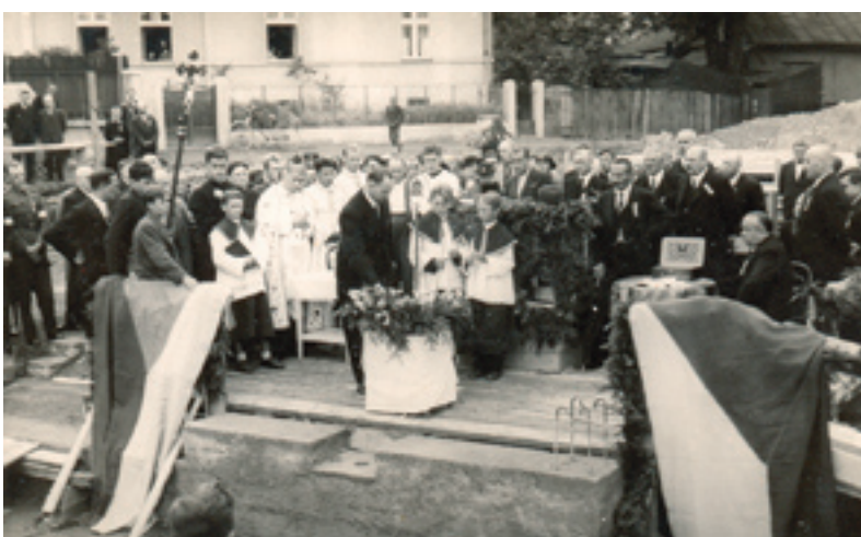
Posviacka a uloženie základného kameňa budovy KKD dňa 11. júla 1937