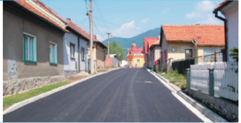
Rekonštrukcia Južnej ulice