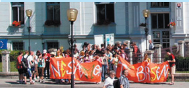
Poézia v uliciach Vrútok