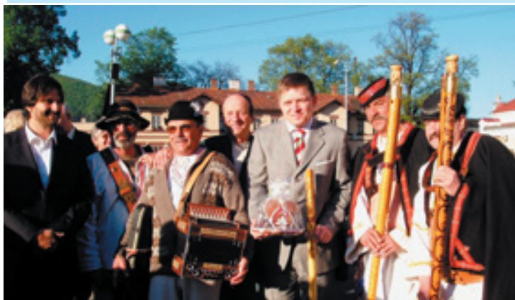
Návšteva predsedu vlády SR Roberta Fica vo Vrútkach pri stavaní mája 30. apríla 2007