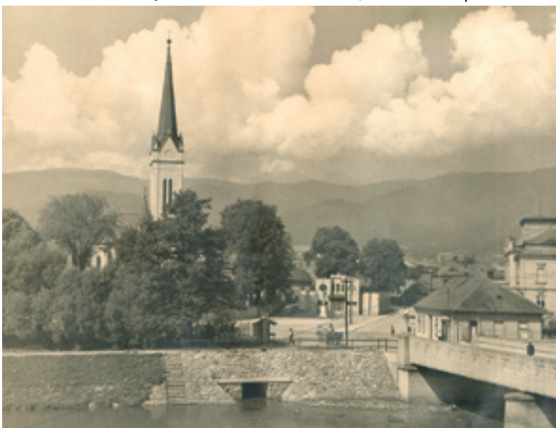
Vpravo od kostola pohľad na Katolícky kultúrny dom a okolie z roku 1950