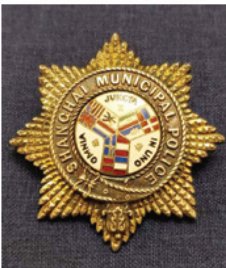
odznak šanghajskej polície