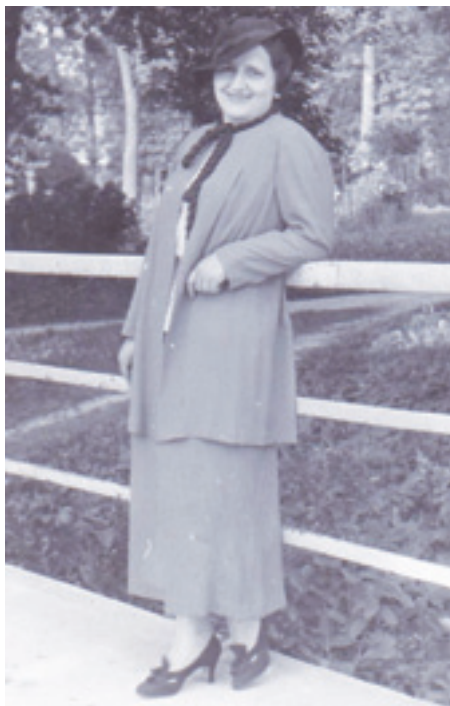
Ella v júli 1936

Neustále sledovala novinky v módných časopisoch. Podľa najnovších trendov a vzorov šila blúzky, sukne, nohavice, košele, šaty, ale aj kabáty a rôzne odevné doplnky. Radila sa aj s vrútockými kraj-