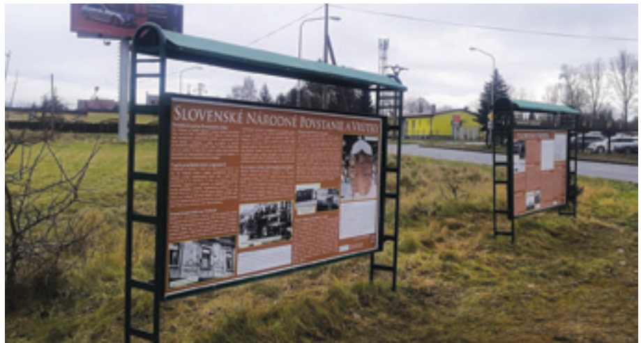
Nový podstavec pod húfnicou a informačné tabule pri pamätníku