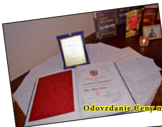
Odovzдание Ceny mesta in memoriam