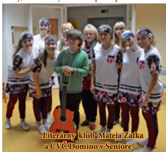
Literárny klub Mateja Zátka a CVČ Domino v Seniore