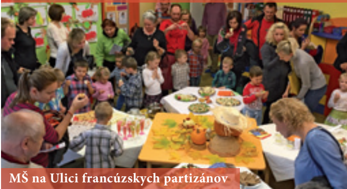
MŠ na Ulici francúzskych partizánov