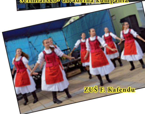
ZUŠ F. Kafendu