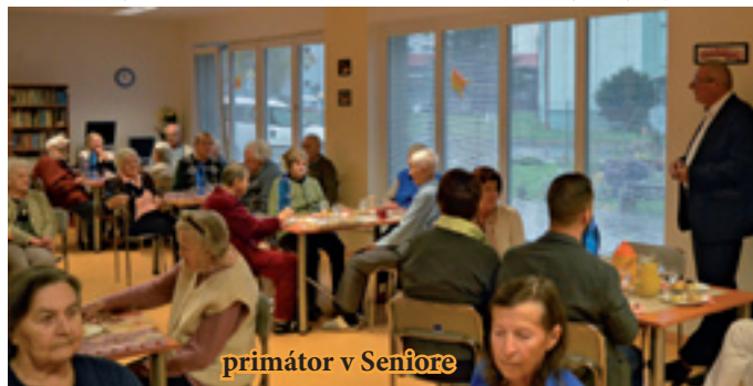
primátor v Seniore