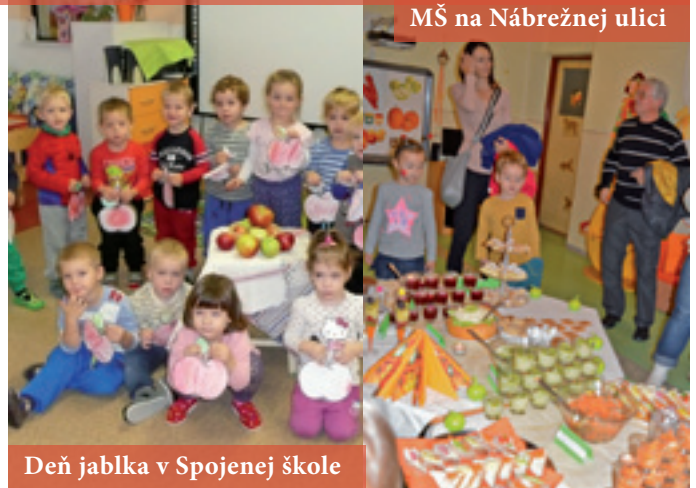
MŠ na Nábřežnej ulici