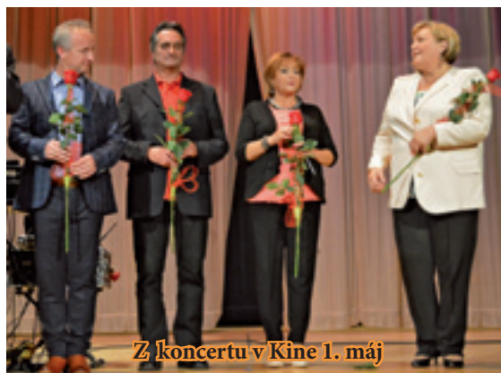
Z koncertu v Kine 1. máj