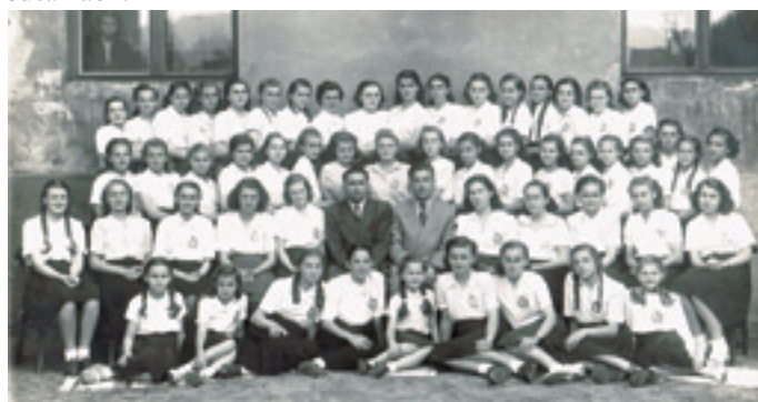
členky speváckeho súboru v roku 1949