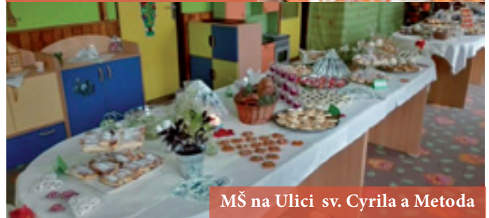
MŠ na Ulici sv. Cyrila a Metoda

15. novembra 2016 si v Kine 1. máj pripomenuli Deň materských škôl všetky vrútocké materské školy. Milým programom potešili svojich rodičov a pedagógov deti z MŠ na Nábřežnej ulici, z MŠ na Ulici sv. Cyrila a Metoda, z MŠ na Ulici francúzskych partizánov a zo Spojenej školy na Ulici M. R. Štefánika.