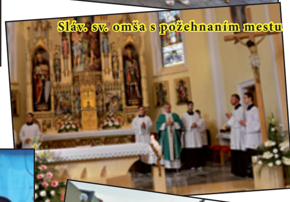
Sláv. sv. omša s požehnaním mestu