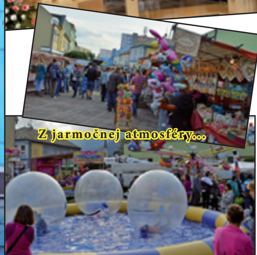
Z jarmočnej atmosféry...