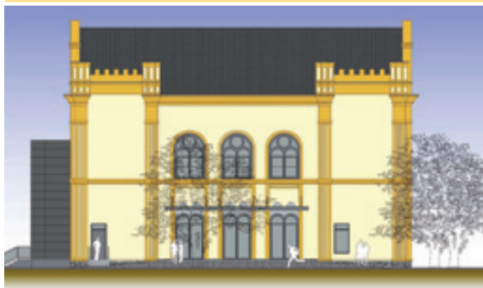
južný pohľad (dnes od zóny detského ihriska)