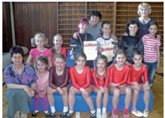
Vrútocké gymnastky so svojimi trénerkami v Bratislave.