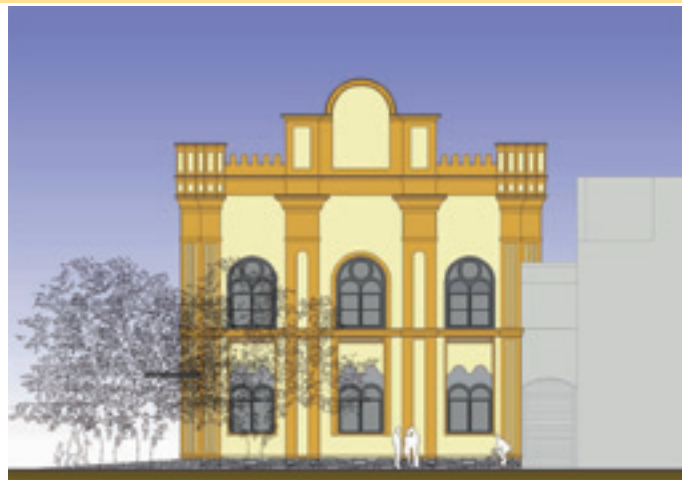
západný pohľad (dnes pohľad od potravín)

Rokmi poznačená budova Kriváňa dostane novú tvár. V zmysle plnenia volebného programu primátora mesta a poslaneckého zboru sa rieši finálna fáza toľkokrát pripomienkovej budovy (bývalej synagógy) – Kriváňa. Celý objekt bol podrobený diskusii a analýze. Výsledkom je, že by v ňom malo byť obnovené vrútocké kultúrne centrum. V minulosti sa tieto priestory využívali na podnikateľské účely (cukráreň, kvetinárstvo, čínsky obchod) čo sa neosvedčilo. Od niektorých nájomníkov sa doteraz vymáhajú dlhy. Aj na základe toho sa mesto rozhodlo, že tento objekt sa bude využívať len ako kultúrna ustanovizeň. Do projektu je zahrnutá aj Mestská knižnica Hany Zelinovej, ktorá by sa sem mala presťahovať, čo uvítajú najmä starší Vrútočania, pretože knižnica bude v prízemných častiach. Vrchná časť sa prerobí na multifunkčnú sálu, v ktorej sa môžu usporadúvať svadby, stužkové slávnosti, kary a rôzne iné spoločenské akcie. V budove sa plánuje dobudovať výťah. Vo Vrútkach sa tým definitívne vyrieši potreba mať reprezentačný kultúrny stánok. Rekonštrukcia sa bude týkať vonkajšej prestavby – nová krytina, najmä nové okná, inžinierske siete a zrekonštruje sa aj interiér. Fasády sa meniť nebudú a zachovávajú sa v pôvodnej podobe. Momentálne je v budove nová výmenička na CZT. Mesto plánuje do zimy zabezpečiť vonkajšie stavebné práce a v zimných mesiacoch pokračovať interiérmi.