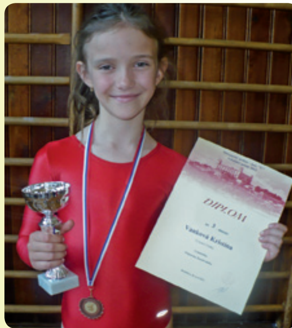
gymnastka – medailistka