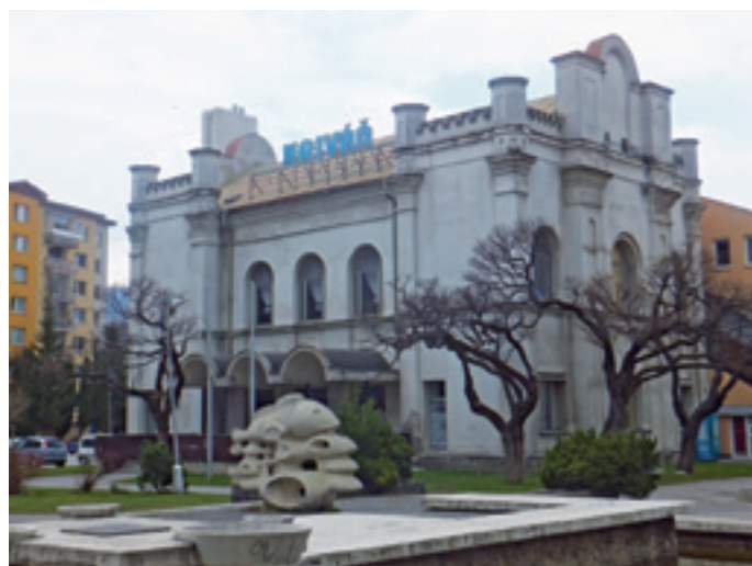
súčasný celkový pohľad na budovu pred rekonštrukciou – foto je z mája 2012

architektonická štúdia – návrhy: Ing. arch. Pavol Jarab