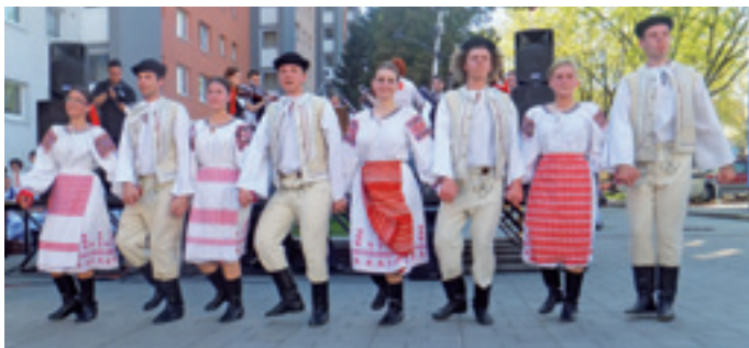
Folklórny súbor Fatran

Ako to na pešej zóne vyzeralo, vidno v našej fotogalérii. text: -red-, foto: MM, RŽ