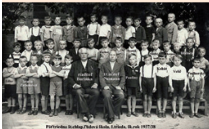
Päťtriedna škola, Ľubová škola, Ľubová, okolie, okolie, okolie 1938