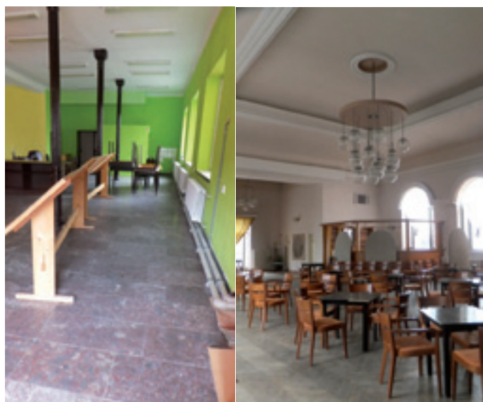
pohľad do interiéru (do týchto priestorov bude presťahovaná Mestská knižnica Hany Zelinovej)