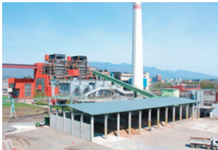
Martinská teplárenská, a. s., Martin

Začiatok roka 2009 potvrdil, že mesto nemôže zostať závislé len od jedného zdroja vykurovania – od plynu. Hľadali sa riešenia. Martinská teplárenská, a. s., má vyriešenú diverzifikáciu zdrojov. Môže ako palivo využívať uhlie, plyn a najnovšie aj biomasu (drevnú štiepku), čo zaručuje vyššiu bezpečnosť dodávky tepla.