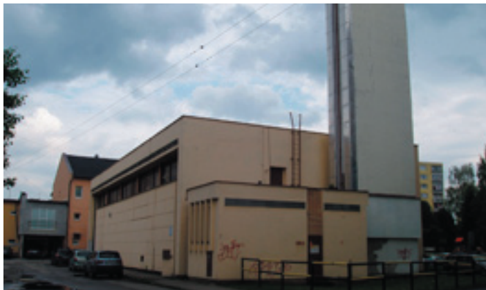
Plynová kotolňa C1 v centre Vrútok