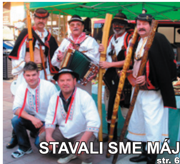
STAVALI SME MÁJ