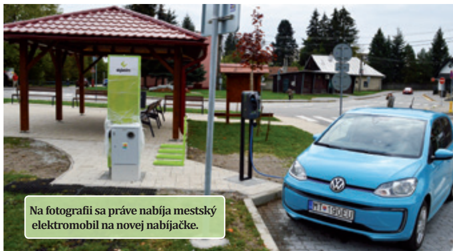
Na fotografii sa práve nabíja mestský elektromobil na novej nabíjačke.

Od novembra získajú vodiči elektrických áut a nadšenci jazdy na elektrických bicykloch možnosť nabiť svoje tátoše na jednom mieste. Nabíjacia stanica pre elektromobily je určená pre dlhodobé nabíjanie striedavým prúdom (AC) s výkonmi od 3,5 kW do 22 kW. Stanica je vybavená káblom s koncovkou Typ 2 (európsky štandard nabíjania), čo umožňuje pohodlné nabíjanie bez nutnosti použiť vlastný kábel nachádzajúci sa vo vozidle. Tento typ nabíjačky je vhodný pre nabíjania s časom dlhším ako 2 hodiny, ktorý je zároveň najekonomickejšou voľbou. Aktuálnu dostupnosť konektora viete zistiť v aplikácii GreenWay alebo na Google Maps. Nabíjačku automobilov je možné spustiť nabíjacou kartou alebo aplikáciou od spoločnosti GreenWay. Technická podpora je k dispozícii nepretržite 24 hodín,