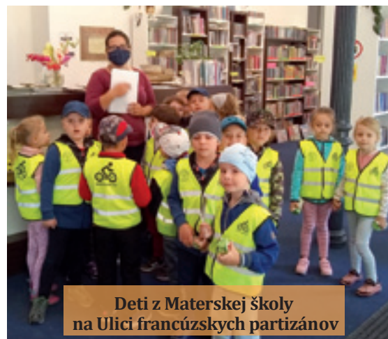
Deti z Materskej školy na Ulici francúzskych partizánov