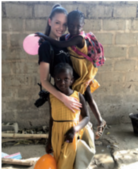
Zo sústreďenia Miss Slovensko 2020 v africkej Gambii