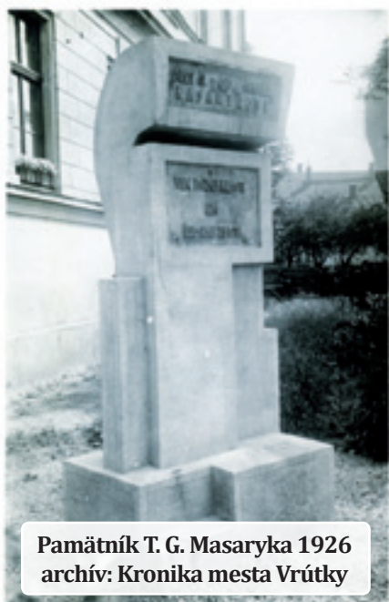
Pamätník T. G. Masaryka 1926