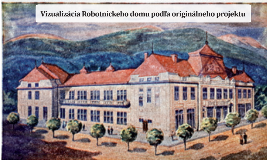
Vizualizácia Robotníckeho domu podľa originálneho projektu