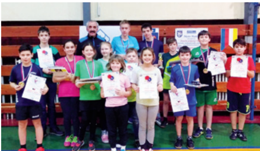
Fotografia z majstrovstiev okresu mládeže, ktoré sa konali v Martine