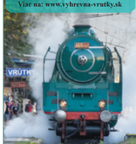
M. Á. V. fűtőház. Heizhaus der M. Á. V.