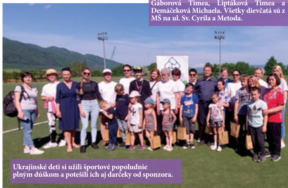
Ukrajinské deti si užili športové popoludnie plným dúškom a potešili ich aj darčeky od sponzora.

Užitočné informácie pre dospelých, športové vyžitie pre deti. Tak vyzeralo popoludnie pre Ukrajincov vo Vrútkach, ktoré 22. mája pripravilo Mesto Vrútky a CVČ Domino s pomocou pedagógov z oboch vrútockých základných škôl. Podujatie bolo realizované s podporou spoločnosti Neografia, a. s., vďaka ktorej si účastníci odniesli z podujatia aj potrebnú materiálnu pomoc. Informácie o možnostiach štátnej podpory pri vzdelávaní a zamestnávaní odídencov poskytli Ukrajincom, ktorí sa dočasne nachádzajú na území nášho mesta, zástupkyne Úradu práce, sociálnych vecí a rodiny Martin.