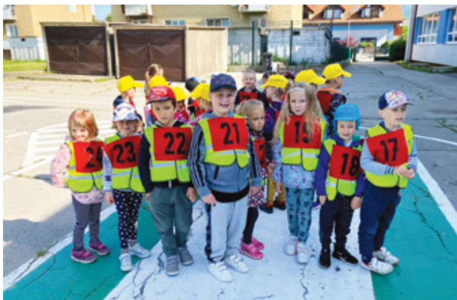
Vrútockí škôlkári dokázali, že sa na ceste vedú dobre orientovať. V popredí deti z MŠ sv. Cyrila a Metoda.