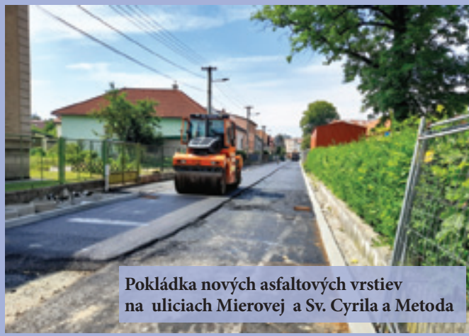
Pokládka nových asfaltových vrstiev na uliciach Mierovej a Sv. Cyrila a Metoda