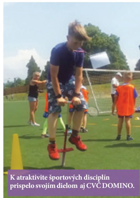
K atraktivite športových disciplín prispelo svojím dielom aj CVČ DOMINO.

Ďalším z podujatí, ktoré sa v tomto roku organizovali aj v duchu propagácie 90. výročia kúpaliska, plávania a vodného póla na Vrútkach, bol aj Vrútocký športový deň. Tak ako Jarný beh detí, aj táto akcia mala počas uplynulých dvoch rokov nútenú covidovú pauzu. Hlavnou myšlienkou podujatia je vytvoriť priestor pre vzájomné spoznávanie sa detí, ktoré sú členmi rôznych vrútockých športových klubov, a dať im šancu cez jednotlivé súťažné disciplíny pripravené