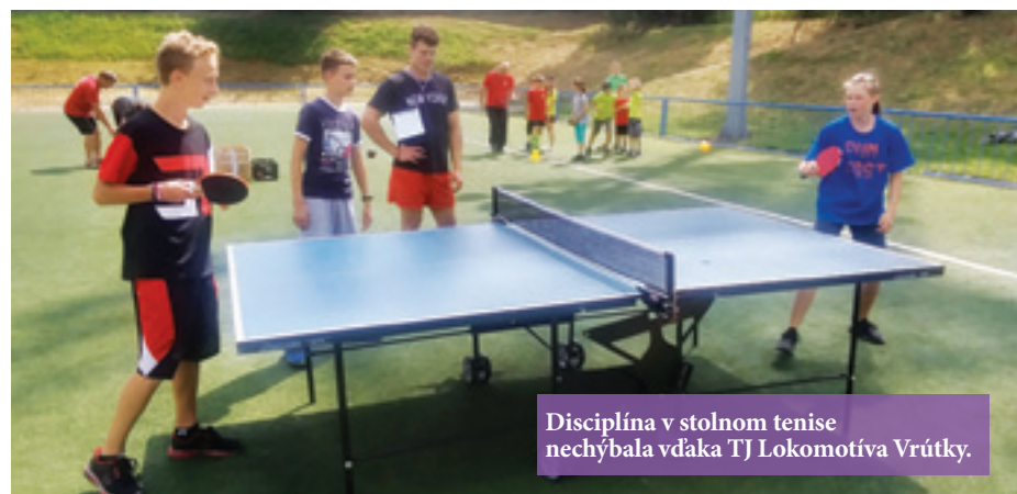
Disciplína v stolnom tenise nechýbala vďaka TJ Lokomotíva Vrútky.