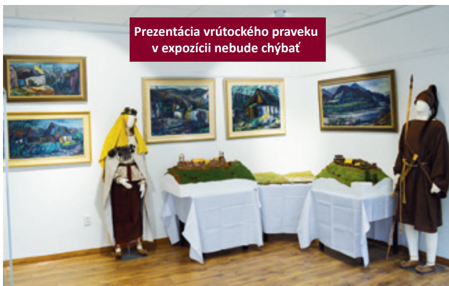
Prezentácia vrútockého praveku v expozícii nebude chýbať