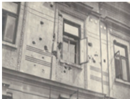
Ostreľované okná hotela Slávia

Situácia vrela aj na Vrútkach. Hory boli pod kontrolou partizánskych jednotiek, ktoré opakovane poškodzovali železnicu a prepádali transporty idúce cez Strečniansku úžinu. 26. augusta, o štvrtej ráno, prišlo na železničnú stanicu asi 15 – 20 Veličkových partizánov. Po zaistení cestujúcich a zablokovaní železničnej dopravy spustili paľbu na okná protiláhleho hotela Slávia, kde bola ubytovaná skupina šiestich nemeckých poľných žandárov. Paľbu Nemci opätovni, obe strany následne použili aj ručné granáty. Asi o 5:45 hod. sa k partizánom pridalo ďalších 40 ozbrojených partizánov na nákladnom aute martinského pivovaru. Časť z nich sa pridala k útoku na hotel, časť kontrolovala prilahlé ulice. Neskôr na partizánov zaútočili dve desaťčlenné hliadky vyslané posádkovou správou vo Vrútkach, partizáni ich ale rýchlo obklúčili a po rusky na nich zvolali: „Slovenskí vojaci nestriehajte do nás, my sme Slovania a prišli sme Vám pomáhať a nemá zmysel, aby slovanská krv tiekla zbytočne“. Následne sa slovenskí vojaci stiahli a sústredili sa iba na zabránenie vstupu civilného obyvateľstva na miesto prestrelky. Jej výsledkom nakoniec bolo päť zastrelených (dva v hoteli Slávia a traja na Hlinkovej ulici v centre Vrútok) a jeden ťažko zranený nemecký žandár.