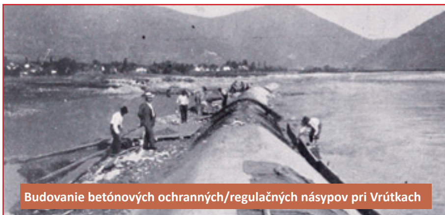
Budovanie betónových ochranných/regulačných násypov pri Vrútkach