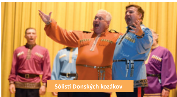
Sólisti Donských kozákov