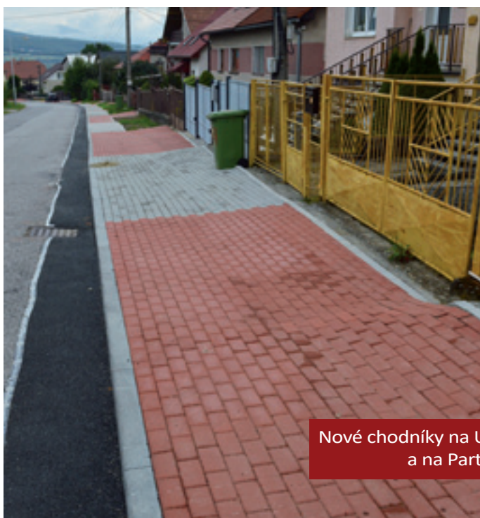
Nové chodníky na Ulici Karvaša a Blahovca a na Partizánskej ulici