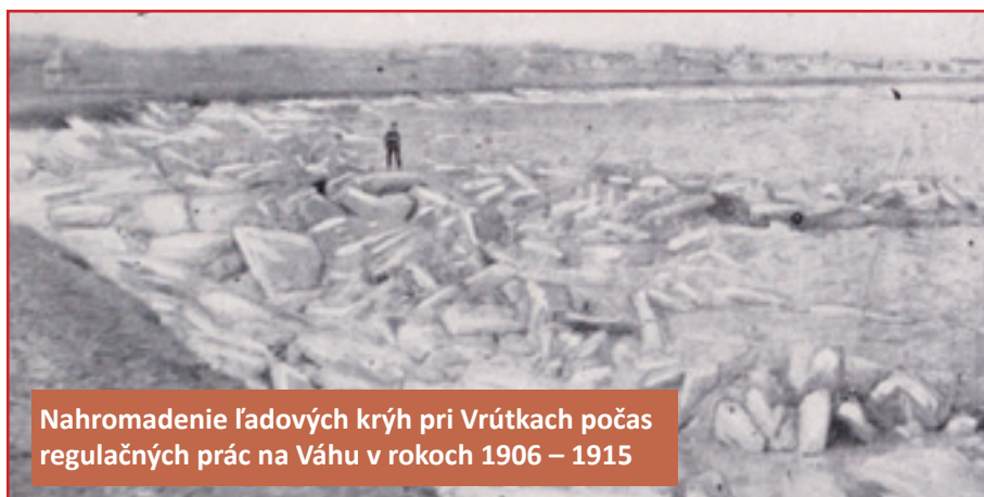
Nahromadenie ľadových krýh pri Vrútkach počas regulačných prác na Váhu v rokoch 1906 – 1915