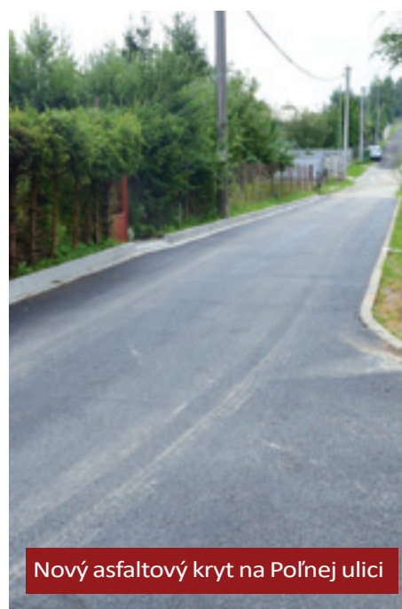
Nový asfaltový kryt na Poľnej ulici