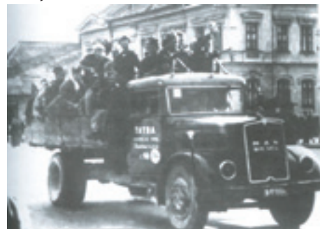
Odchod francúzskej jednotky do bojov v Strečnianskej tiesňave

Jednotka francúzskych partizánov sa v Turci formovala z mladých francúzskych utečencov internovaných v Maďarsku, resp. z Francúzov na nútených prácach v Dubnici nad Váhom. Ich prvou bojovou úlohou bolo obsadenie Vrútok 28. augusta 1944. V tom čase ich jednotka mala 99 mužov. Obsadili