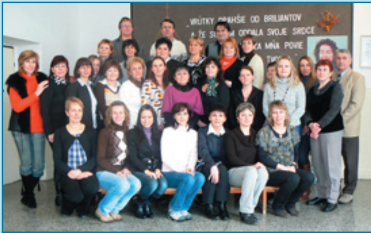
Z osláv MDŽ - kytička od primátora