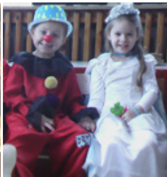
deti vrútockých materských škôl boli naozaj „kúzelné“

Detské pesničky, smiech, veselosť a zábava sa ozývali posledný fašiangový týždeň kultúrnou sálou Kriváň i MŠ na Ul. sv. Cyrila a Metoda. Deti sa premenili na víly, princezné, zvieratká a bojovníkov, indiánov a čarodejníkov. Fašiangujúci si pochutili na šiškách a poriadne vytancovaní a spokojní sa rozlúčili.