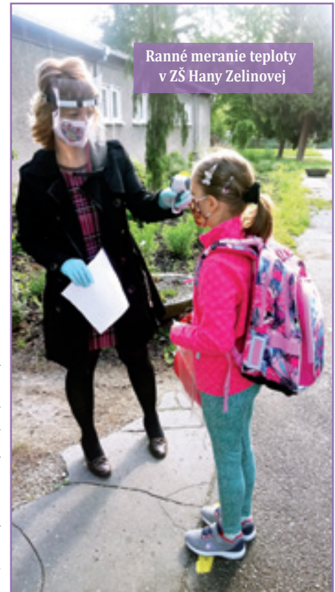
Ranné meranie teploty v ZŠ Hany Zelinovej

Dňa 10. 3. 2020 s účinnosťou od 11. 3. 2020 rozhodol primátor mesta na základe odporúčania krízového štábu vo Vrútkach o dočasnom prerušení vyučovania v školách a školských zariadeniach v zriaďovateľskej pôsobnosti Mesta Vrútky. Vláda SR vyhlásila dňa 12. 3. 2020 mimoriadnu situáciu a opatrením Úradu verejného zdravotníctva SR s platnosťou od 13. 3. 2020 bola zakázaná prevádzka zariadení pre deti a mládež. Dňa 16. 3. 2020 boli zatvorené všetky materské školy, školy, univerzity a voľnočasové zariadenia pre deti a mládež. Minister školstva SR na