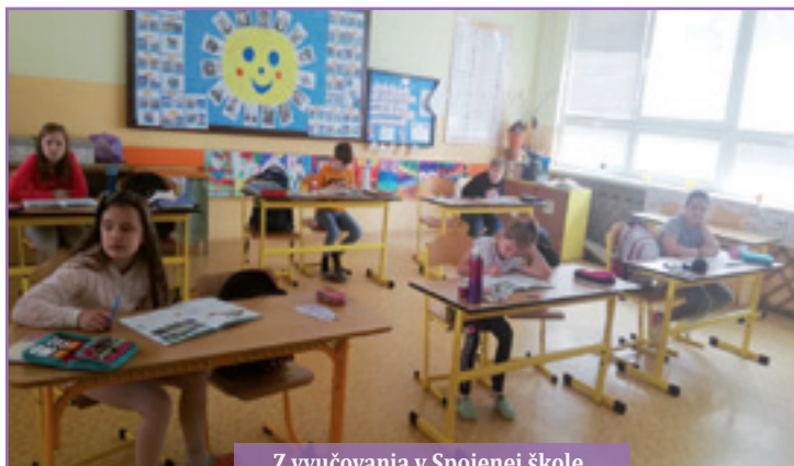
Z vyučovania v Spojenej škole