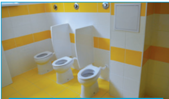
Nové toalety v Materskej škole na Nábřežnej ulici