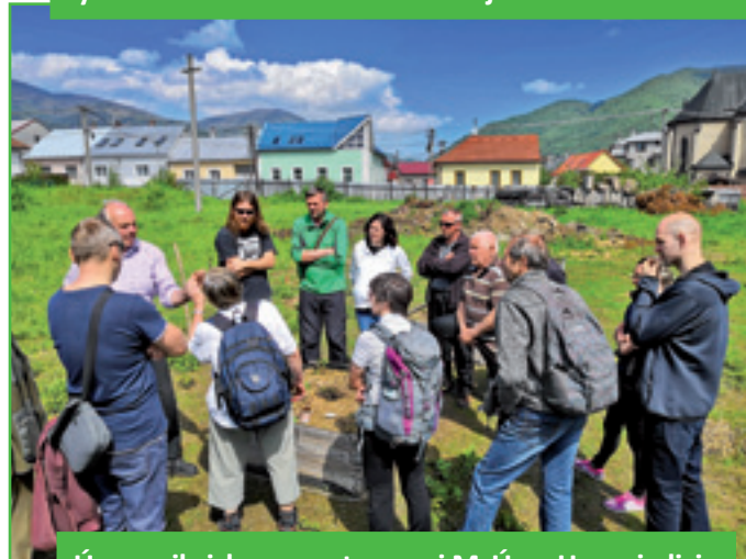
Úprava ihriska zamestnancami MsÚ na Hornej ulici