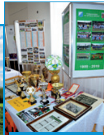
Z výstavy k 110. výročiu športu