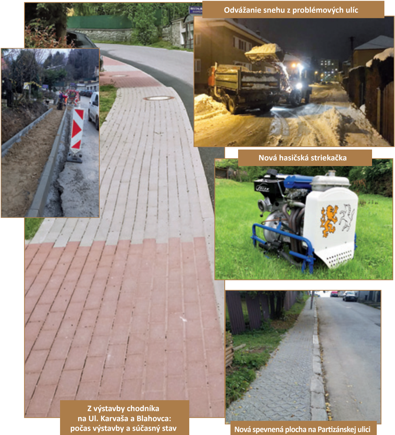
Odvážanie snehu z problémových ulíc

Na vybraných mestských objektoch sa menili vchodové dvere, odkvapové žľaby, rekonštruovalo sa vykurovanie a uskutočnila sa deratizácia bytov na Kafendovej ulici. Opravila sa fasáda bývalej kotolne na Kalinčiakovej ulici, opravila sa strecha mestského úradu a vymaľovala sa sobášna sieň . V snahe udržať zjazdnosť komunikácií pristúpilo mesto v januári 2019 k odvážaniu snehu z najproblémovjších ulíc. S očistou chodníkov pomohla aj brigáda za účasti členov dobrovoľného hasičského zboru, ktorí v ďalších dňoch pomáhali odstraňovať cencúle z mestských objektov. Ich vybavenie v tomto roku obohatila aj nová hasičská striekačka .