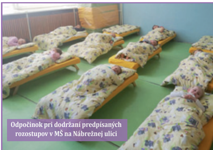
Odpčinok pri dodržaní predpísaných rozstupov v MŠ na Nábrežnej ulici

V mesiaci máj sa začali uvoľňovať opatrenia v súvislosti s mimoriadnou situáciou vyhlásenou z dôvodu šírenia nebezpečného ochorenia COVID-19. Minister školstva SR, Úrad verejného zdravotníctva vydali rozhodnutia, ktorým po rozhodnutí zriaďovateľa môžu byť od 1. 6. 2020 otvorené materské školy, základné školy 1. – 5. ročníka a základné umelecké školy