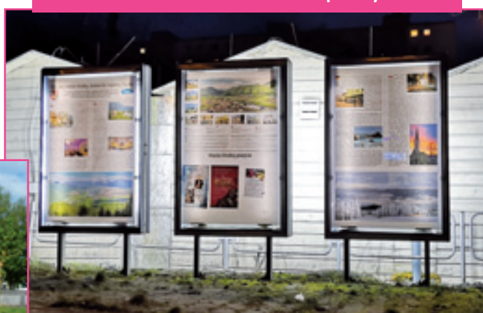
Nové turistické informačné panely