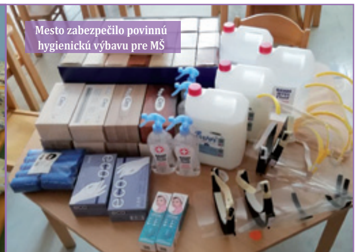
Mesto zabezpečilo povinnú hygienickú výbavu pre MŠ