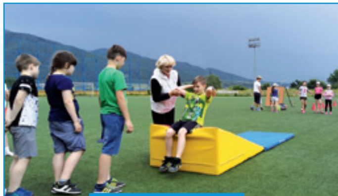
Vrútocký športový beh

V spolupráci s miestnymi športovými klubmi, pre ktoré boli v roku 2019 prerozdelené historicky najvyššie dotácie z mestského rozpočtu , zorganizovalo mesto Vrútocký športový deň . Uskutočnili sa tiež tradičné podujatia ako Jarný beh detí či Silvestrovský beh . Vďaka dotácii z Úradu vlády SR sa zakúpila nová športová výbava, opravili sa koše na streetballovom ihrisku . Svoje klubové a šatňové priestory svojpomocne obnovili členovia vodnopólového a futbalového klubu a hokejbalisti z vrútockej Komety kompletne zrevitalizovali svoje ihrisko. Medzinárodný deň detí v roku 2019 na Vrútkach prebehol pod profesionálnou organizačnou taktovkou mestskej polície.