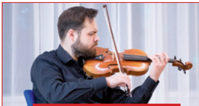
Z koncertu Dalibora Karvaya na Vrútkach