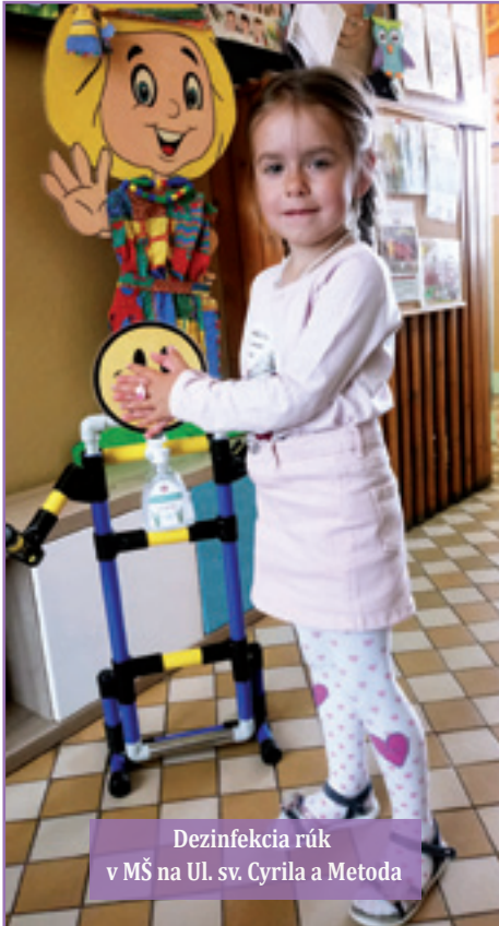
Dezinfekcia rúk v MŠ na Ul. sv. Cyrila a Metoda

základe zákona č. 56/2020 Z.z. prerušil vyučovanie na školách a riaditelia škôl mali zabezpečiť (ak to bolo možné) dištančné (dial'kové) vyučovanie.