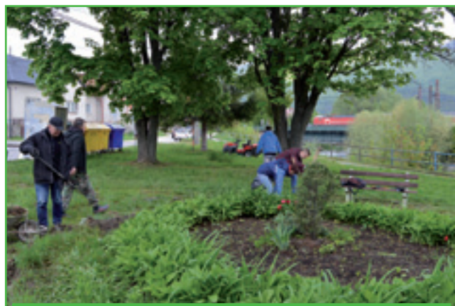
Parčík na Ul. Horná Kružná pred a po revitalizácii

Očistu a údržbu verejných priestranstiev realizovanú celoročne pracovníkmi oddelenia komunálnych služieb mestského úradu podporili tiež viaceré mestom organizované brigády. Zapojili sa do nich obyvatelia, zamestnanci mesta, poslanci mestského zastupiteľstva a dobrovoľní hasiči. Nanovo sa natreli mnohé lavičky aj zábradlie na železobetónovom moste cez Turiec, opravili a ponatierali sa detské ihriská , na dvoch z nich (pred Kriváňom a na Mokradi) sa doplnili nové hracie prvky . Brigádnici tiež zbavili mesto množstva odpadu, pred sviatkom Všetkých svätých vyhrabali lístie na mestskom cintoríne . Revitalizoval sa aj parčík na Ul. Horná Kružná.