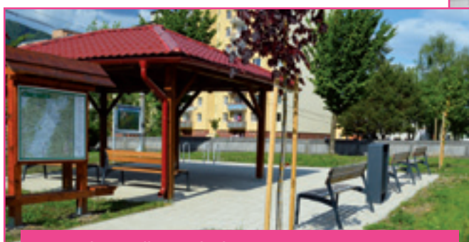
Nová odpočinková zóna pri moste cez Turiec