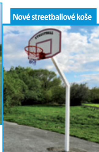
Nové streetballové koše