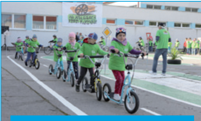
Dopravné ihrisko v Spojenej škole

Mesto v roku 2019 významne vstúpilo do modernizácie školskej infraštruktúry. Začala sa rekonštrukcia telocvične pri ZŠ Hany Zelinovej . Nový šat dostali aj sociálne zariadenia, sprchy a šatne telocvične Spojenej školy na Ul. M.R.Štefánika . Ukončila sa kúpa budovy Materskej školy na Ul. sv. Cyrila a Metoda a mesto okamžite pristúpilo k výmene okien a vymalovaniu interiérov . Odstránil sa havarijný stav komína na ZUŠ Frica Kafendu, modernizovali sa tiež interiéry Materskej školy na Nábřežnej ulici , a to vo forme rekonštrukcie sociálnych zariadení pre našich najmenších a vybavenia kuchyne. Podobná investícia sa uskutočnila aj v Materskej škole pri Spojenej škole, ktorá sa tiež môže pochváliť novým dopravným ihriskom .