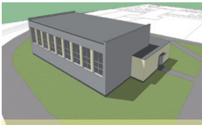
vizualizácia opravenej telocvične pri ZŠ Hany Zelinovej