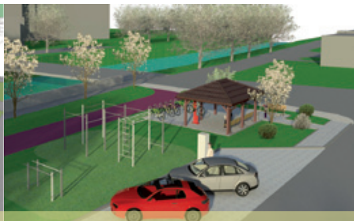
vizualizácia odpočinkovej zóny pri cyklotrase