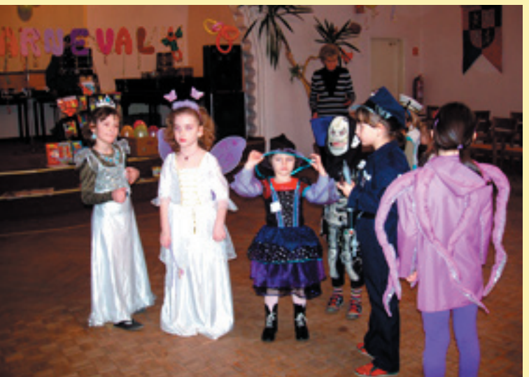
Z karnevalu CVČ DOMINO