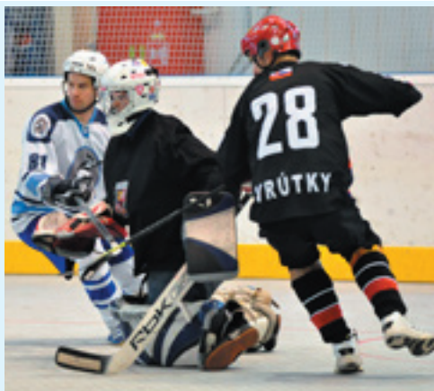
Plzeň - Vrútky