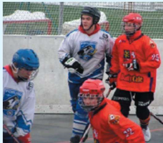
Zápas dorastu v Opave