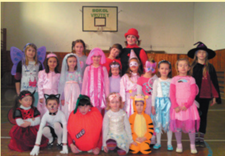
Takto boli pondelok pred Popolcovou stredou vyobliekané malé gymnastky TJ Sokol Vrútky na karnevale v sokolovni.