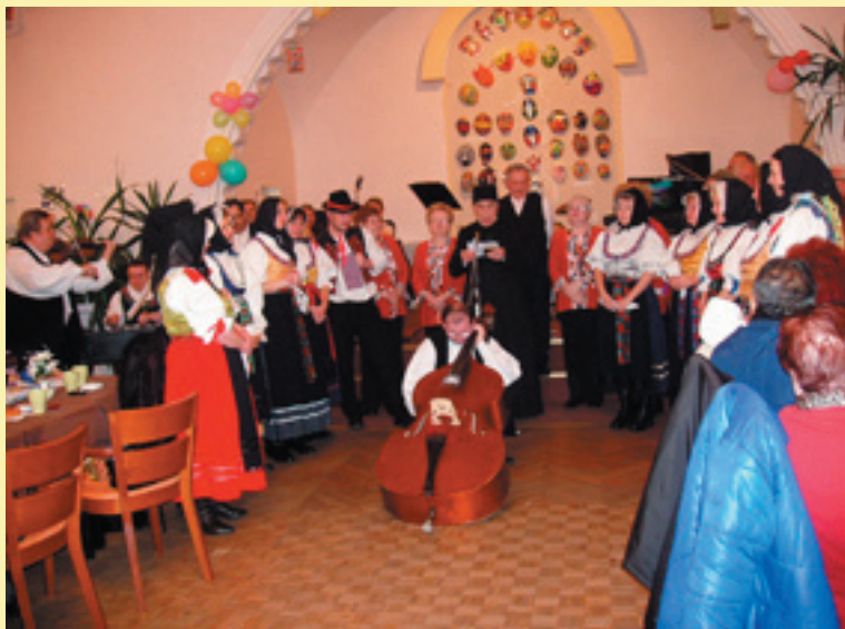
Basu sme pochovali, fašiang sa skončil...

Prijmeme ambiciózných spolupracovníkov do obchodnej činnosti. Voľná pracovná doba, výška zárobku podľa aktivity. Tel.: 0905 425 686