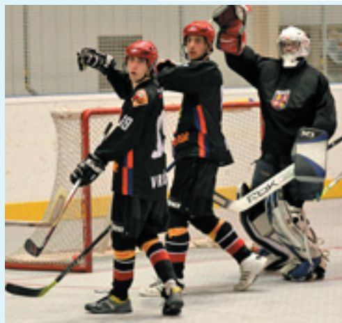
Zo zápasov Vrútky – Oberwill