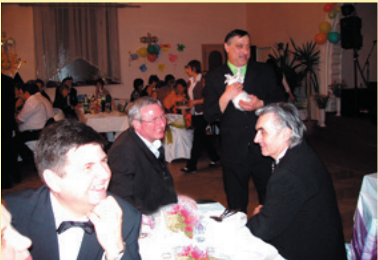
Výhra v tombole – živý zajačik. Čo s ním?