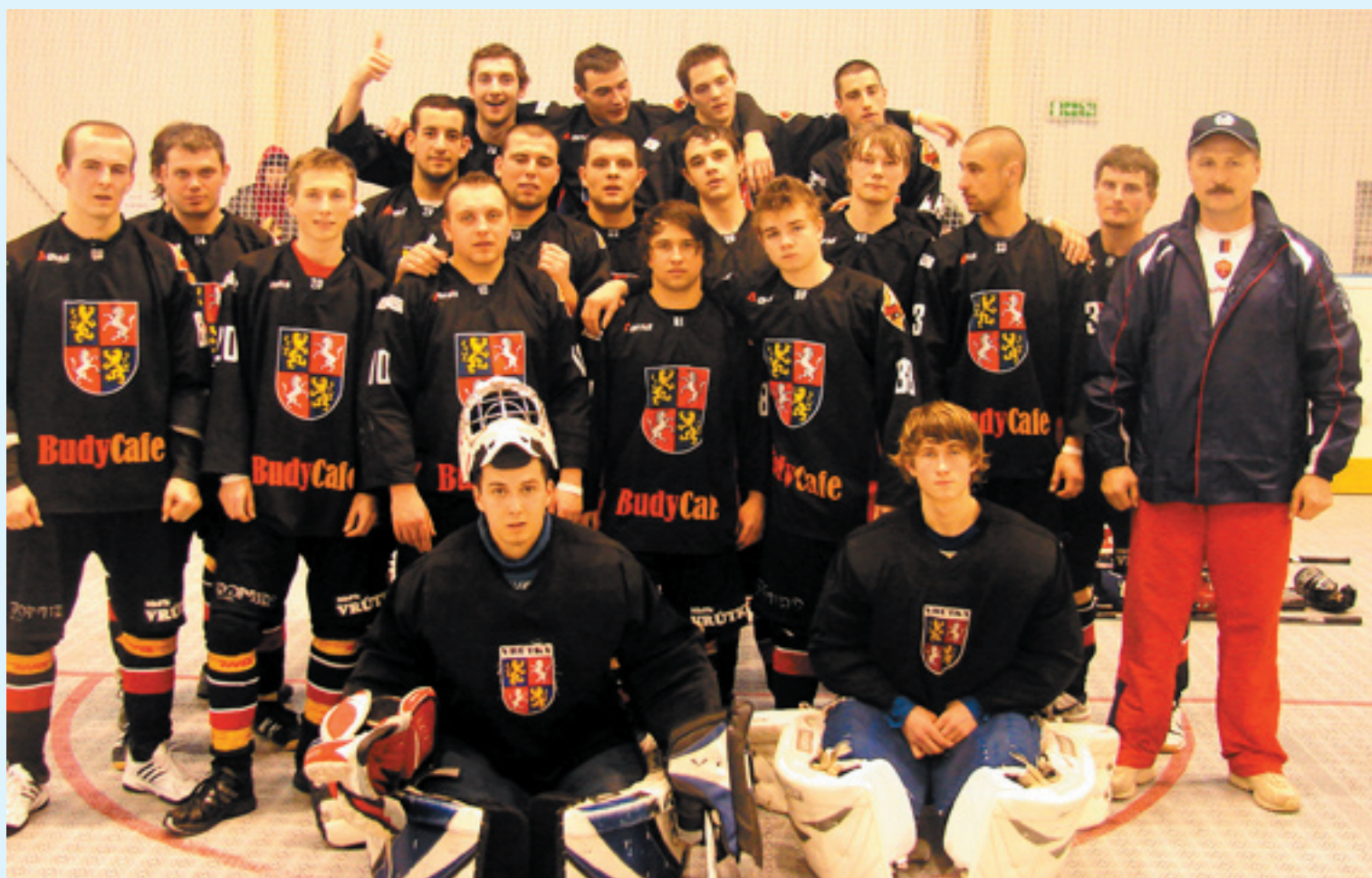
Hokejbalový tím KOMETA Vrútky na turnaji PILSEN CUP 2010