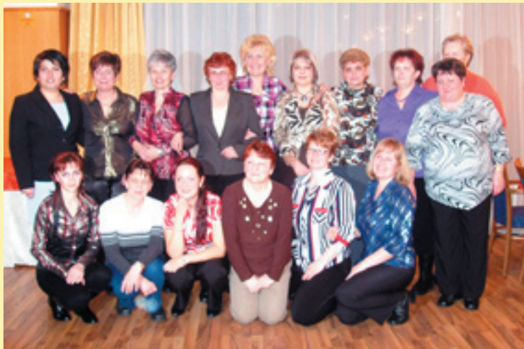
Kolektív pracovníčok jubilujúcej MŠ na Nábrežnej ul.