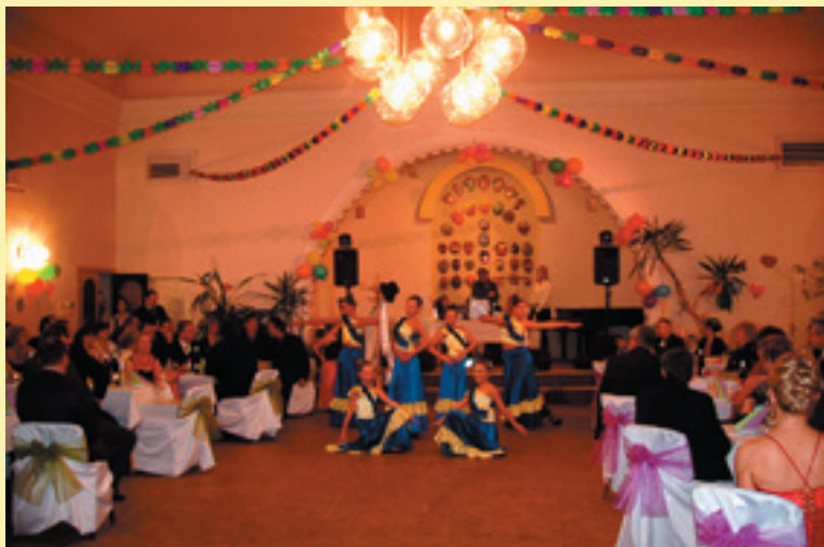
Plesová nálada na druhom fašiangovom ples