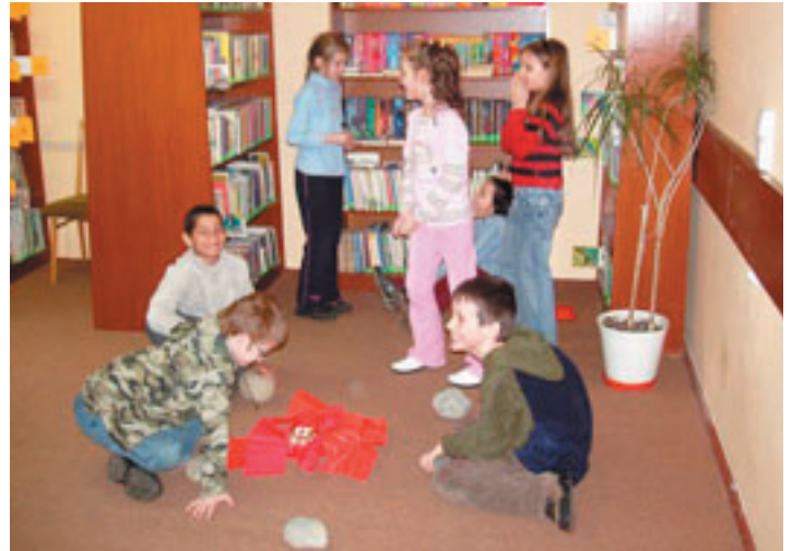
Dramatizácia rozprávky O dvanástich mesiacikoch

Ale to nebolo všetko. Deti sa aj s rozprávkou zahrali. Už počujem vašu otázku! Ako sa to dá? Veď rozprávky sa čítajú, počúvajú alebo pozerajú. V detskom svete je všetko možné. A deti naozaj nesklamali. Samy sa stali postavičkami, ba dokonca aj rekvizitami z rozprávky. Ožili a potom sa už len tešili z toho, ako sa nádherne stotožnili s tým, čo si predtým