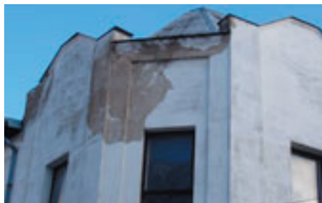
Kto uhradí spôsobené škody?

A tak nastal problém súdneho sporu či „budova v stave rozsiahlej rekonštrukcie je chápaná v zmysle zákona o majetku obcí pod pojmom nevyužívania na vyučovací proces s totožným sa len ako prerušenie vyučovania“.