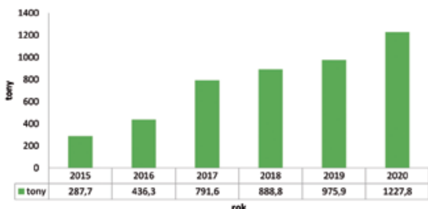
separovaný zber 2015-2020