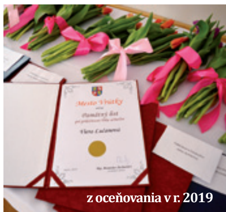
z oceňovania v r. 2019