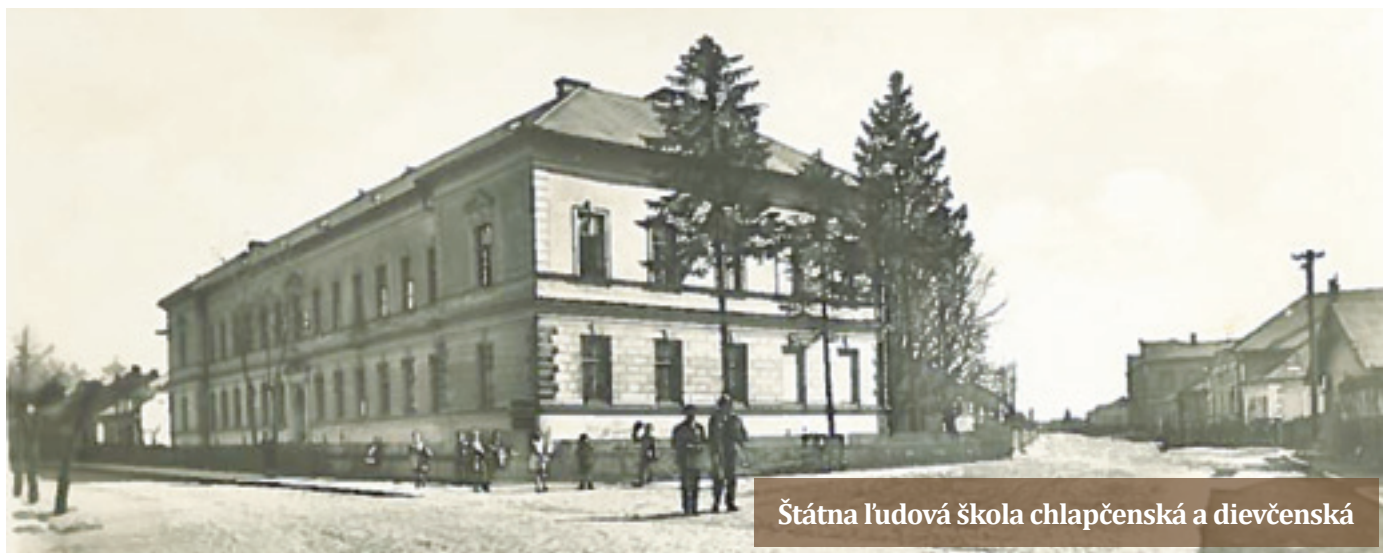
Štátna ľudová škola chlapčenská a dievčenská

žiaci sú neprístupní a ich rozumové schopnosti veľmi obmedzené. V rozprave k návrhu zákona o boji proti pohlavným chorobám presadzovala zavedenie „pohlavnej výchovy“ na školách, ktorá mala odbúrať predsudky a nepravdy šírené v rodinnom prostredí. Ako tiež uviedla, „co vím od školních lékařů, že je značné procento žáků měštanských škol, kteří trpí kapavkou, že jsou takové i mezi žákyněmi, což vím z vlastní zkušenosti, že i mezi žákyněmi měštanských škol jsou již prostitutky, uvítá každý, že zlům těmto bude konečně povinna čeliti i škola.“