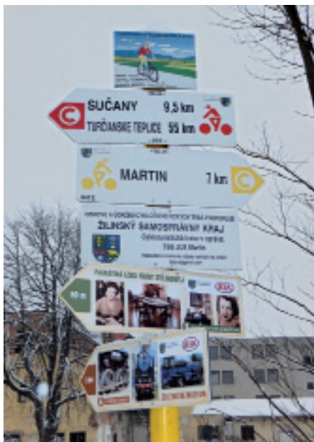
Cykloturistické značenie pred mostom vo Vrútkach

Na sklonku roku 2012 členovia Turčianskej bicyklovej skupiny JUS obnovili a doplnili cykloturistické značenie v Turci. Zamerali sa najmä na výmenu poškodených cykloturistických máp, ako aj obrázkových cyklotabuliek, ktoré smerujú cykloturistov k objektom nachádzajúcim sa na šiestich tematických historických cyklotrasách v našom regióne. Obnova v podobe výmeny mapy a opätovného osadenia obrázkových cyklotabuliek poškodených vandalmi neobišla ani Vrútky. Tabuľky upozorňujú na významné objekty zaradené