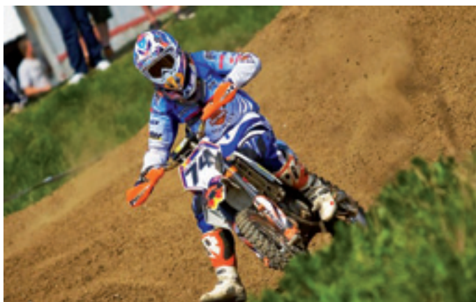
Na majstrovstvách sveta v motokrose juniorov v Talianskej Cingoli v roku 2011