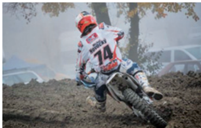
Na majstrovstvách Českej republiky na trati v Třemošnici v roku 2012