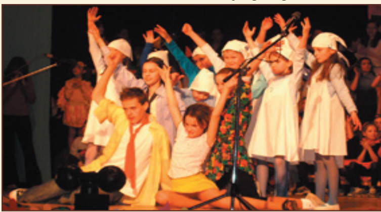
Akadémia pri príležitosti 40. výročia školy

VRÚTOČAN * Vydáva: Mesto Vrútky * Adresa redakcie: Ul. 1. čs. brigády 14, 038 61 Vrútky * Tel.: 043/428 12 03 * e-mail: pullmannova@vrutky.sk * Nevyžiadané rukopisy a fotografie redakcia nevracia * Stanoviská v jednotlivých článkoch môžu a nemusia odrážať stanovisko redakcie * Zodpovedná redaktorka Ing. Helena Pullmannová * Jazyková redaktorka Elena Režná * Za redakčnú radu: Ing. Ján Mlynár, Božena Blahušáková * Grafická úprava: redakcia * Uzávierka dopisovateľských materiálov do 17. dňa v mesiaci * Tlač: Neoprint Plus, Za mostom, Vrútky * Číslo reg.: 260/1991 * Foto na obálke: Fašiangová nálada v centre Vrútok * Foto: HP