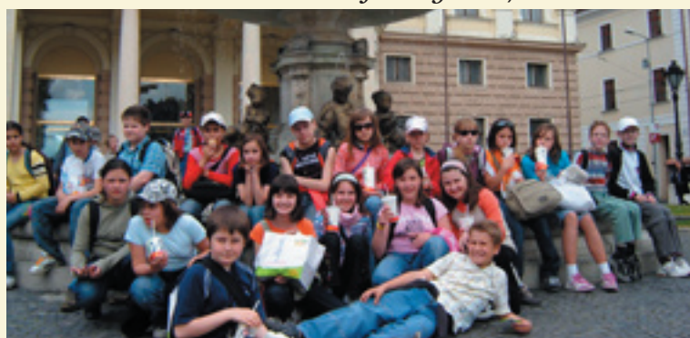
Na výlete za umením