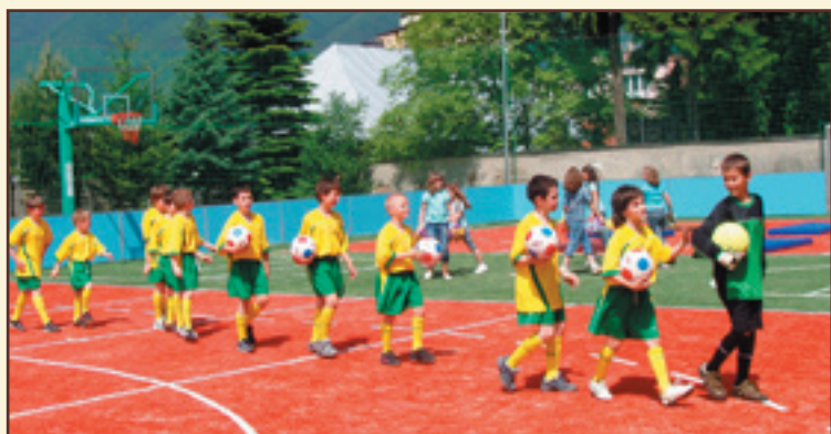
Otvorenie ihriska s umelým povrchom