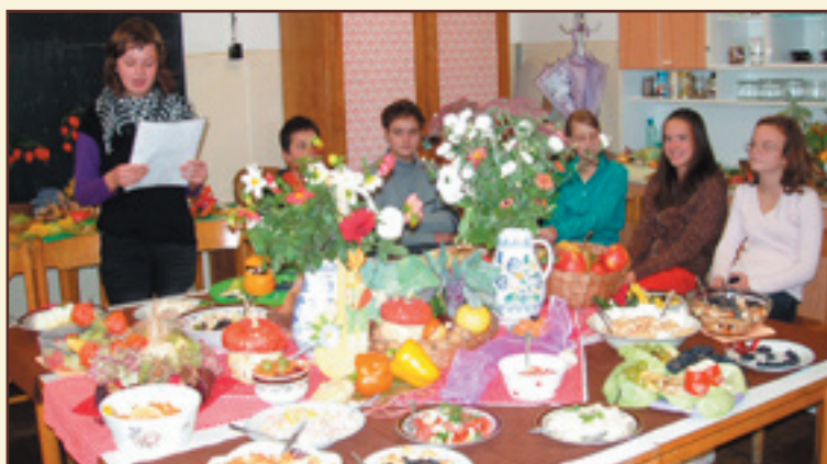
Prezentácia zdravej výživy