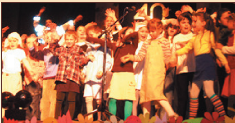
Akadémia pri príležitosti 40. výročia školy