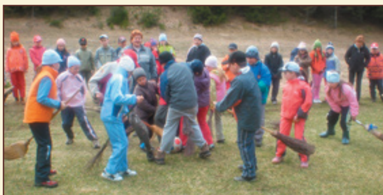
V škole v prírode