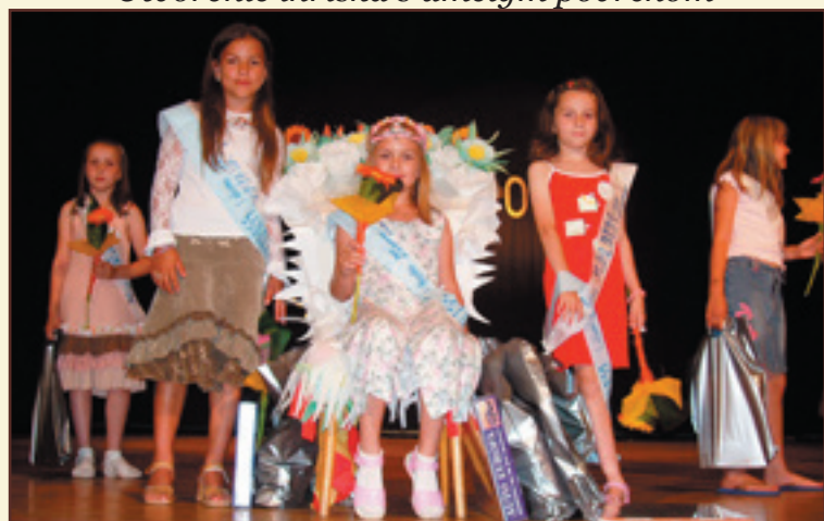
Miss Základnej školy 2007