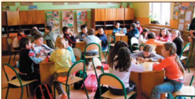
Tradične-netradične v škole