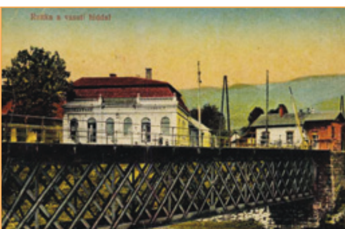
Vrútocké železničné pohľadnice. Vľavo záber na Výchrevňu Košicko-bohumínskej železnice na pohľadnici vrútockého vydavateľstva Felvidéki Magyarorság, vpravo pohľad na železničný most cez Turiec na pohľadnici budapeštianskeho vydavateľstva Vasúti Levelezőlapárusítás.