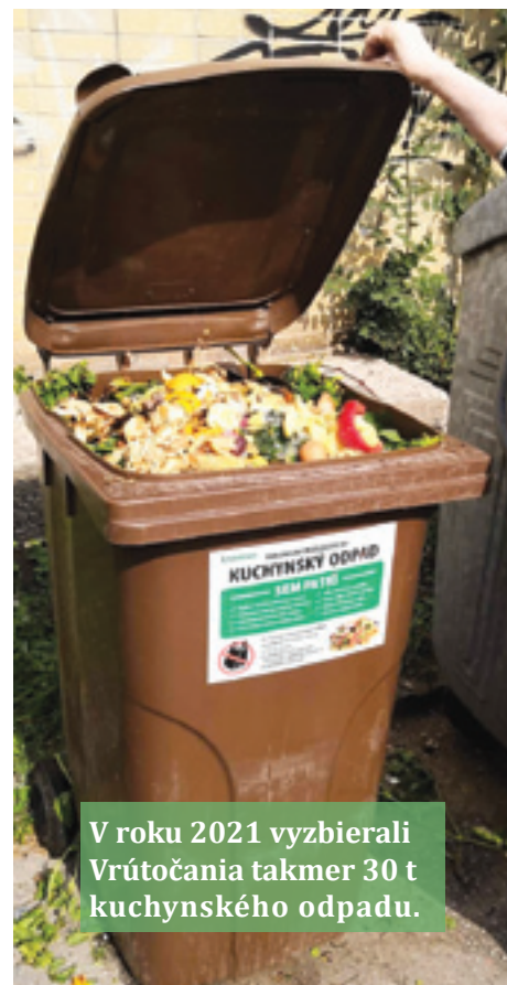
V roku 2021 vyzbierali Vrútočania takmer 30 t kuchynského odpadu.

Upozorňujeme, že sa mení systém zberu papiera od rodinných domov, a to nasledovne. Obyvatelia rodinných domov si môžu vyzdvihnúť 2 ks modrých vriec na MsÚ vo Vrútkach (dvere č.206, Ing. Dana Pozorčiaková). Do týchto vriec budú separovať papier a ich vývoz sa bude realizovať raz štvrtročne - podľa harmonogramu. Vývoz bude priamo od rodinných domov, tak ako pri zbere plastov. Pri vývoze Vám vývozná firma