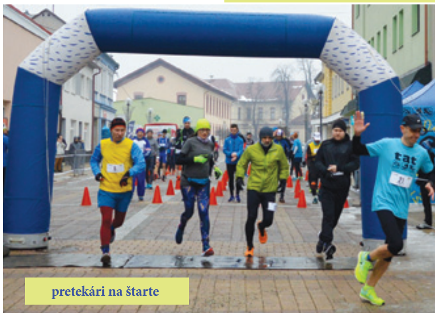
pretekári na štarte