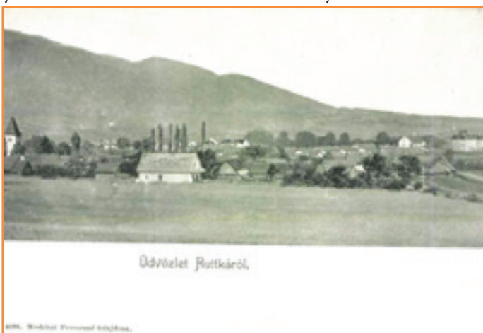
Vrútocké pohľadnice z maďarskej tlačiarne F. Moškóciho v Martine. Na pravej pohľadnici je vidieť vežu pôvodného gotického kostolíka Sv. Jána Krstiteľa.