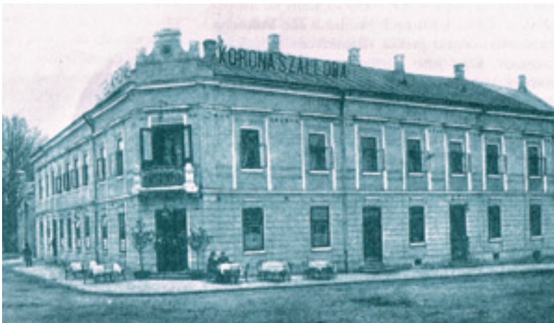
Hotel Slávia zo začiatku 20. storočia (predtým hotel Korona)