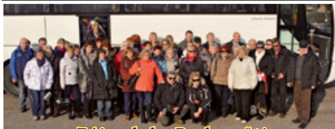
Zájazd do Budapešti