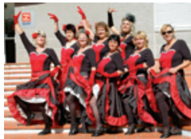
Ženy Sokola Vrútky v Toulouse – v kostýmoch skladby Kabaret

Aj oddiel športovej gymnastiky dostal počas Dní mesta 2014 Pamätný list za 20 rokov činnosti a práce s deťmi a mládežou. Ocenenie mesta Vrútky prevzali spoločne gymnastky aj