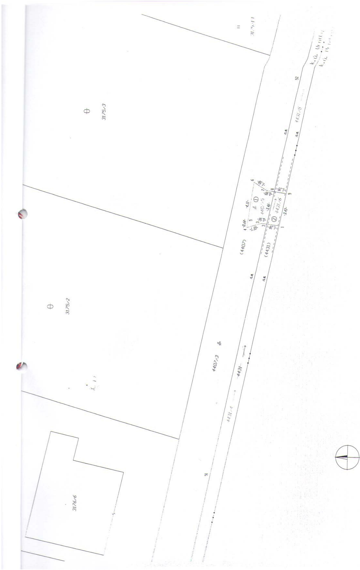
Grafická část ku GP č. 58/2013